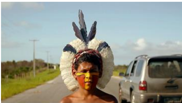
Diferentes cocares Pataxó- Frames documentário

No entanto, o exemplo dos trajes indígenas não nos mostra uma imagem étnica congelada,