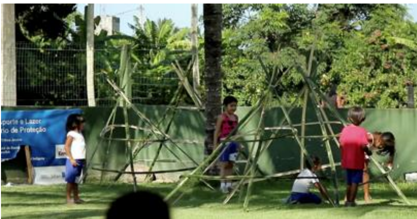
Alunos na escola de Barra Velha construindo ocas de bambu durante a feira de ciências- Frame documentário

escola indígena de Coroa Vermelha houve o desfile da primavera, onde as crianças saíram fantasiadas pela cidade até o marco do Descobrimento, acompanhadas por um carro de som tocando música Pataxó. Na escola de Barra Velha, estive presente na feira de ciências que durou quase a semana inteira. Alunos e professores, com auxílio também de pais, fizeram diversas experiências com produtos locais