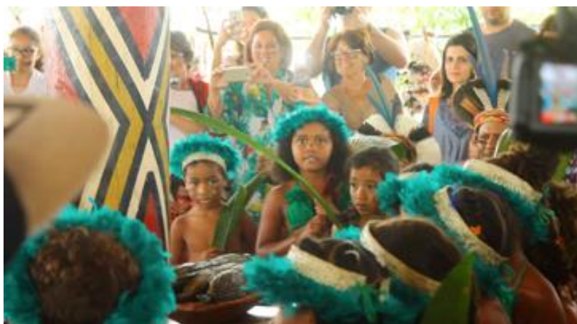
Alunos da escola indígena de Nova Coroa em uma apresentação para turistas na mesma aldeia

que estavam na creche (que se situa ao lado da oca onde os indígenas recebem os visitantes) juntaram-se aos seus professores, todas trajadas, para participar do auê. Nos auês da escola, com a ausência de visitantes, o ritual é o mesmo que é feito nas arenas turísticas, exceto pelos trajes. Assim, o aspecto performático e visível,