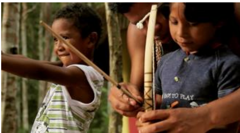
Alunos praticando arco e flecha durante aula- Frame documentário

“nada mais é do que o fortalecimento espiritual para nós, povos indígenas”. Ele acontece diariamente na escola, mas nota-se a presença predominante dos alunos mais novos. Isso foi justificado por um dos professores pelo fato dos outros professores, mesmo sendo indígenas, não julgarem este ritual tão importante e não levarem seus alunos. Outra professora apontou para o fato de que, a partir do ensino médio, entram alunos não indígenas na escola indígena, ou mesmo alunos indígenas que sempre estudaram em escolas não indígenas e que têm vergonha de “mostrar sua cultura” 53 . De fato, a partir do ensino médio, a única escola que há em Coroa Vermelha é a escola indígena. Por conta disso, essa teve que abrir suas portas para alunos não indígenas. Outra hipótese para a não participação é que, na escola, há períodos em que a merenda não chega ou não é suficiente. Sem comer, os alunos não podem ter o mesmo rendimento, até porque, segundo a coordenação, alguns deles, tendo poucas condições financeiras, contam com a merenda escolar para