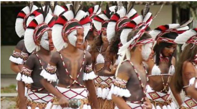
Trajes Pataxó

O marker , nesse caso, representa aspectos culturais ligados a um passado distante (ocas, choupanas, trajes) ou que talvez nunca tenham sido usados por essa etnia específica; eles correspondem porém a um imaginário do que seriam as aldeias indígenas. Barthes (apud Culler, 1990) assinala que: “Desde que existe uma sociedade, todo o uso é convertido em um signo de si mesmo”. Segundo MacCannell, esses signos, que se enquadram na reconstructed ethnicity seriam “[...] o fim do diálogo, aquele momento aonde a imagem étnica é artificialmente congelada” (MACCANNELL, 1986:181, tradução minha). Os Comaroff (2009) dizem algo parecido a MacCannell ao estudarem a emergência de etnicidades em casos de turismo étnico: