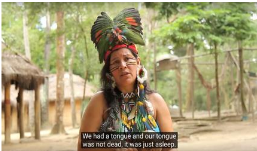
Nayara- Reserva da Jaqueira- Frame documentário

A Reserva da Jaqueira é um ponto de referência cultural para os Pataxó. Foi lá onde nasceu o grupo de pesquisa da língua patxohã, o grupo Atxohã. Segundo um informante, no começo do projeto, na parte da tarde, os indígenas se reuniam na Reserva e ocupavam-se em praticar a língua, fazer caminhadas conhecendo o mato, e partilhavam histórias. Hoje