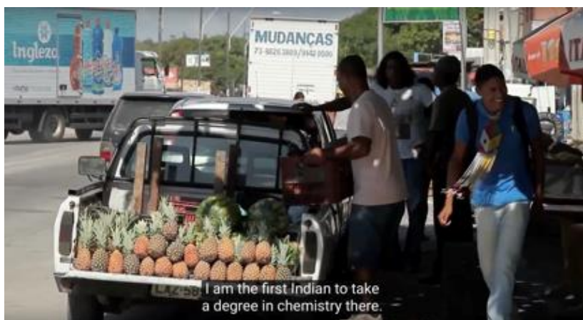
Suryasun, Reserva da Jaqueira- Frame documentário

Em Barra Velha, hoje em dia, a escola indígena é uma realidade: todos os alunos inscritos são indígenas. A escola cobre até o final do ensino médio e ninguém manifesta interesse de fazer essa parte dos estudos fora da aldeia. A escola indígena de Coroa Vermelha apresenta porém características diferentes. Apesar do grande e crescente número de alunos indígenas inscritos, ainda há uma porcentagem que vai estudar em escolas não indígenas. Em Coroa Vermelha mesmo, há três escolas não indígenas. Vivendo em contexto urbano, os jovens estão sujeitos a diversas influências