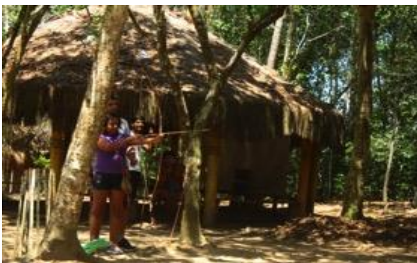
Turistas praticando arco e flecha na Reserva da Jaqueira

fazer a primeira refeição do dia e não comem em casa. A direção adotou como solução a redistribuição e diminuição do tempo das aulas para poderem liberar os alunos mais cedo. Essa pode ser uma outra razão para os mais velhos não participarem no auê no início das aulas, pois perderiam mais do pouco tempo que têm de aula. Já na aldeia de Nova Coroa, que possui uma creche, presenciei os professores levando seus alunos para participar do auê que estava sendo feito para turistas. Esse acontecimento mostra como a aprendizagem de certos aspectos da cultura Pataxó não passa somente pela escola. As regiões de staged authenticity , proposta por