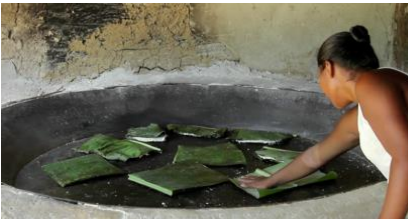
Aluna fazendo beiju na casa de farinha durante a feira de ciências em Barra Velha- Frame documentário

Destaca-se porém a utilização desse direito do calendário para eventos em pequena escala, na comunidade. A coordenadora da escola de Coroa Vermelha disse que quando há morte de alguém da comunidade, familiar de aluno ou aluno, não há aula por uma questão de solidariedade. Como são comunidades pequenas, quase todos se conhecem, então tal acontecimento é possível de tocar um grande número de pessoas. Durante o trabalho de campo, tive igualmente a oportunidade de assistir a alguns eventos excepcionais do calendário das escolas de algumas comunidades. Na