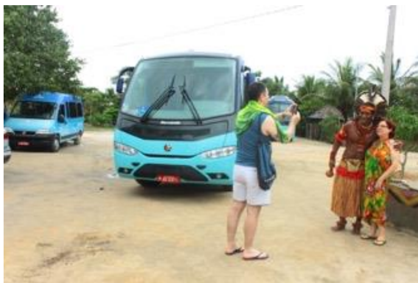
Turista posando para foto com Pataxó na área turística de Nova Coroa

Por exemplo, no caso dos Pataxó, podemos encontrar esse aspecto no uso dos trajes indígenas. Como vimos, esses não são usados no cotidiano (exceto para quem trabalha com o turismo), apenas em ocasiões especiais: datas festivas, manifestações políticas. Alguns são eventos que representam a indianidade para fora. Em outros, é a própria comunidade indígena que se auto