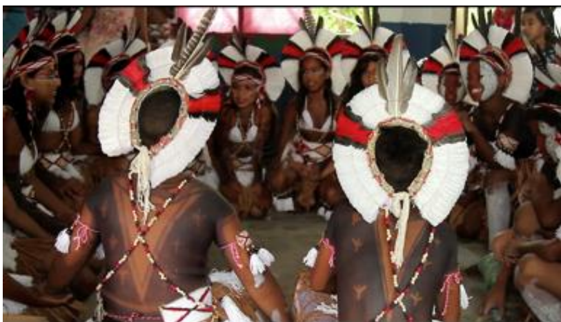
Alunos no dia da formatura intercultural- Frame documentário

não sejam exibidas nas arenas turísticas, esses produtos são usados lá: a piaçava nas construções das ocas, o peixe e a patioba para servir o prato típico Pataxó para os turistas. Essas atividades, que não eram mais exercidas pelos Pataxó em seu cotidiano, ganharam uma nova importância. Por mais que essas