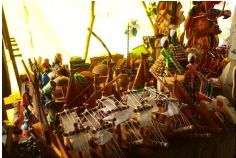
Souvenirs “bairanos”

Encontram-se também à venda nas aldeias, além do artesanato étnico, souvenirs da Bahia e da região. Os souvenirs não indígenas são muito variados: chaveiros, miniaturas de berimbaus 20 , porta retratos decorados com conchas, camisetas com escritas de Porto Seguro, baianas, caravelas, cataventos, araras de madeira... Esses elementos denotam a inscrição da atividade turística dos Pataxó em um movimento turístico maior, que não é o turismo que os Pataxó pretendem oferecer.