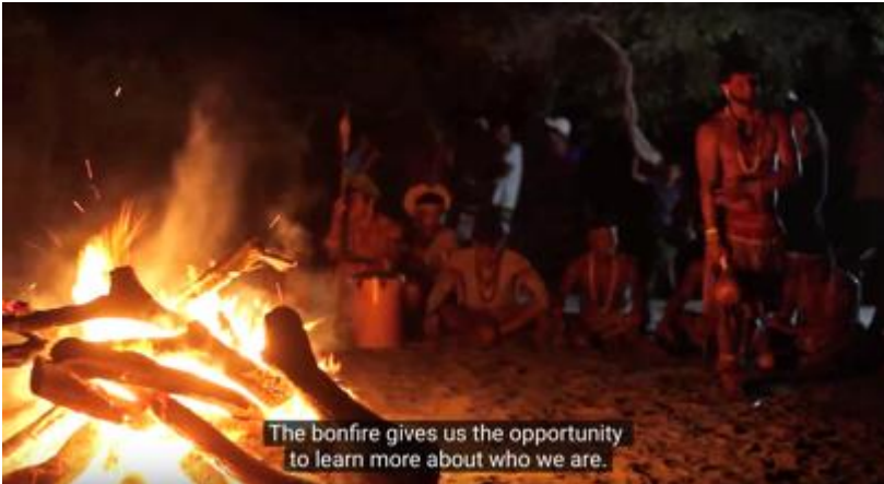
Fogueira na aldeia de Barra Velha durante ritual- Frame documentário

“A nossa forma de viver, a nossa forma de se alimentar, tudo eu aprendi com a minha mãe e passo pra os meus filhos. É à noite fazendo um fogo em frente ao nosso kijeme, contando a história para os meus filhos.