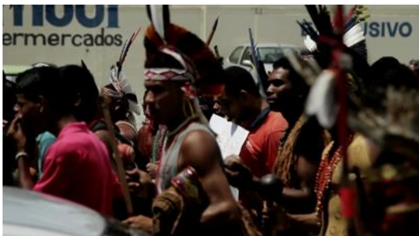
Manifestação para a demarcação do território de Ponta Grande- Frame documentário

de suas atrações, o que acaba por diversificar o seu arsenal "cultural": seja criando músicas e coreografias novas, contando novas histórias aos turistas, adicionando itens ao tour na aldeia (por exemplo o tour para ver armadilhas, invenção recente, que nem todas as aldeias oferecem ainda).