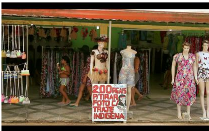
Loja passarela indígena de Coroa Vermelha- Frame documentário

Todas essas arenas turísticas reconhecem a legitimidade das representações umas das outras. No entanto, há uma grande disputa pela maior autenticidade, quem seria mais ligado à cultura. Apesar do turismo ser uma prática cultural, é também um meio de sobrevivência econômica. Apesar dos Pataxó enfatizarem em suas apresentações para os turistas, que o turismo é uma prática cultural e econômica, viver do turismo e ao mesmo tempo viver a cultura no turismo é gerador de conflito nas representações de autenticidade. Mesmo na Jaqueira, um lugar de grande reconhecimento, alguns índios apontam que as atividades econômicas ligadas ao turismo interferiram no funcionamento do local como um lugar de referência para os Pataxó. Membros dos dois núcleos de turismo mais recentes (Nova Coroa e Txagr'u Mirawê) consideram que os indígenas que cobram pelas manifestações da cultura se importariam menos com a prática e conservação dessa cultura, como os indígenas na passarela que cobram para tirar foto com turistas e a Jaqueira, que cobra a entrada na Reserva.