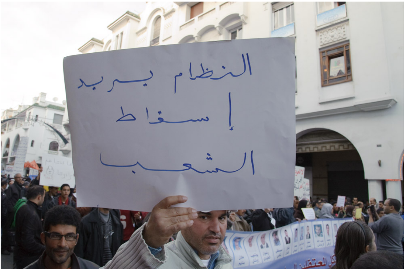
Imagem de uma manifestação do Movimento 20 de Fevereiro em Rabat, realizada no dia 21 de fevereiro de 2012, celebrando o primeiro aniversário deste movimento. No cartaz lê-se: “O regime quer a queda do povo”.