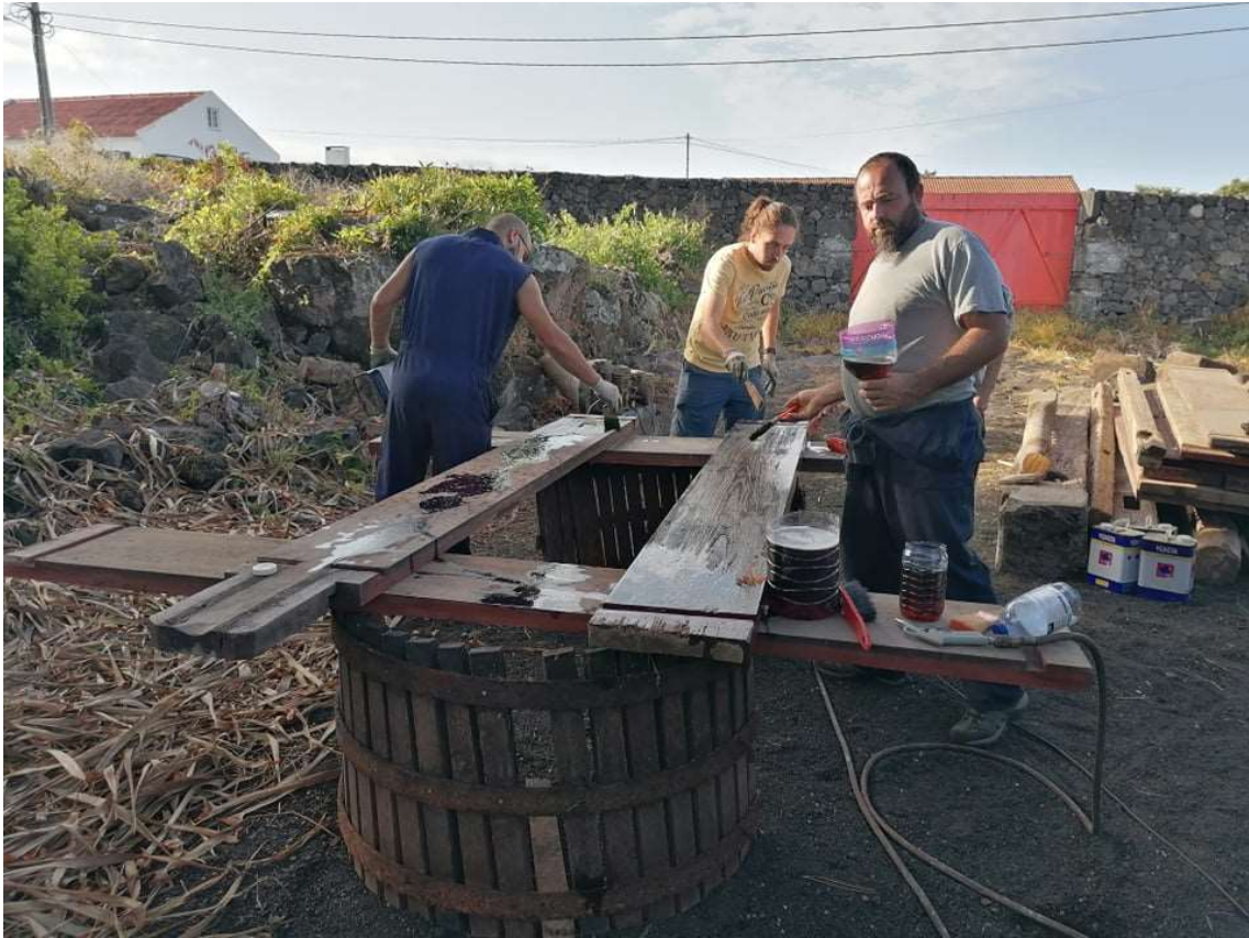
Figura 5: Museu do Pico, Limpeza e tratamento das peças do lagar, 15 de Outubro 2020