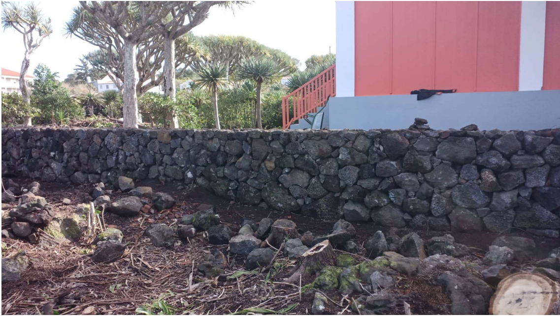
Figura 7: Museu do Pico, Reconstrução terminada, 28 de Janeiro 2021