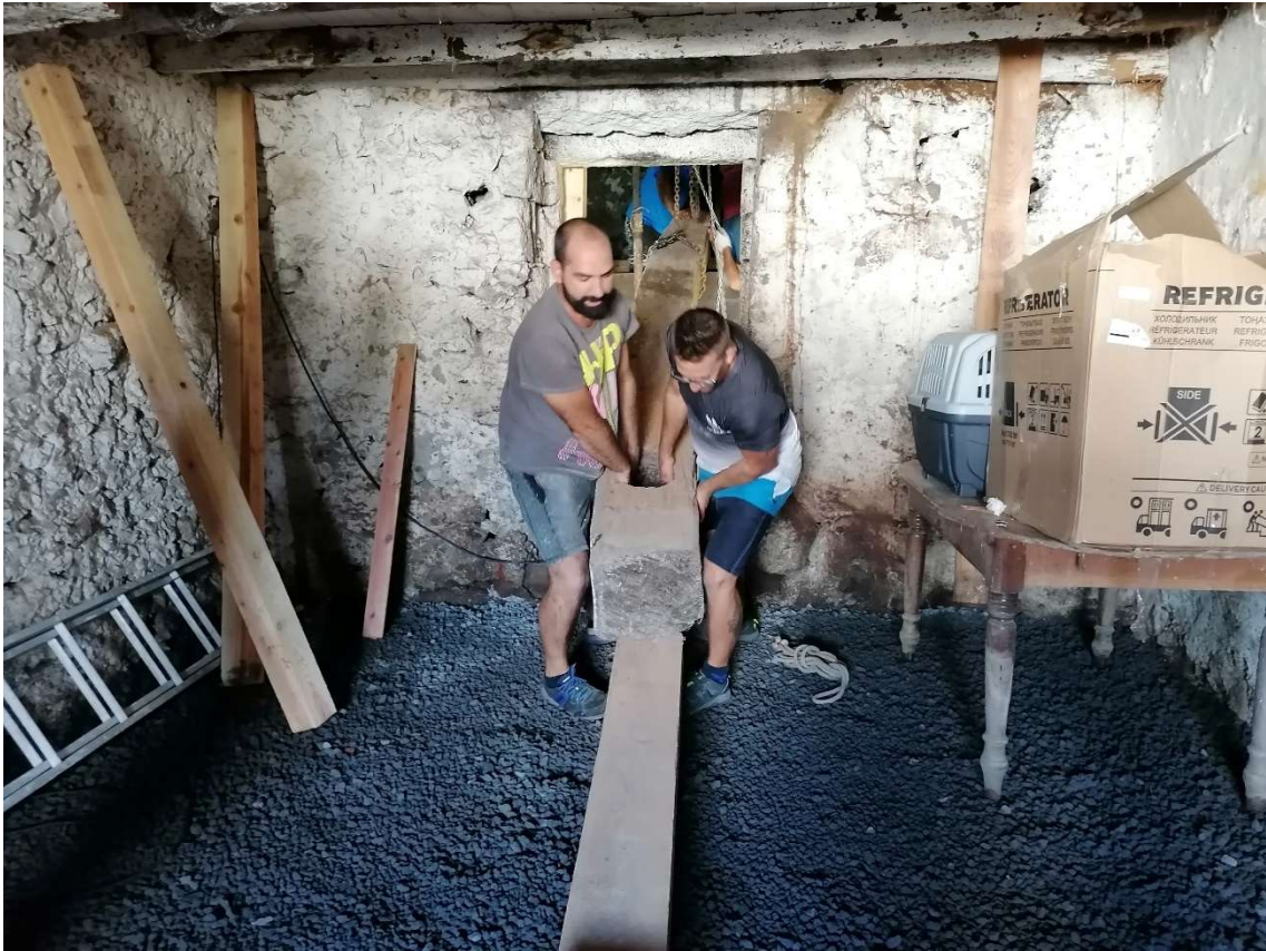
Figura 3: Museu do Pico, Remoção do lagar, 8 de Outubro 2020