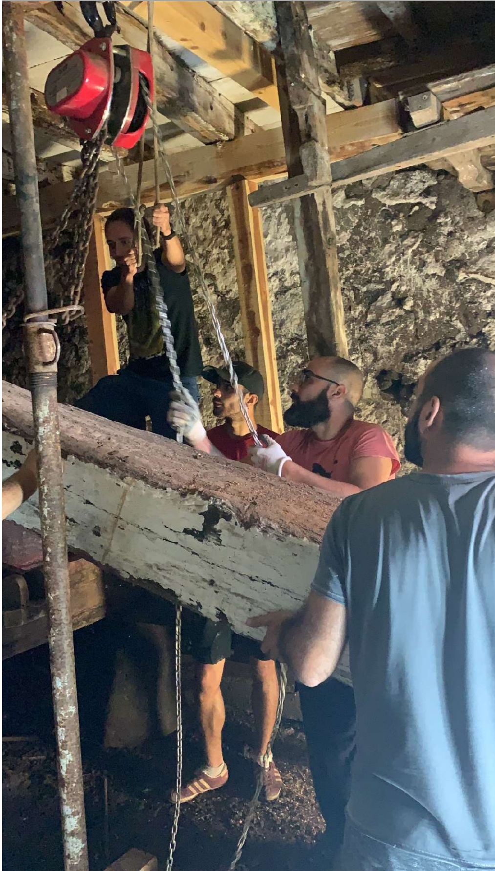
Figura 2: Museu do Pico, Desmontar a lagar, 8 de Outubro 2020