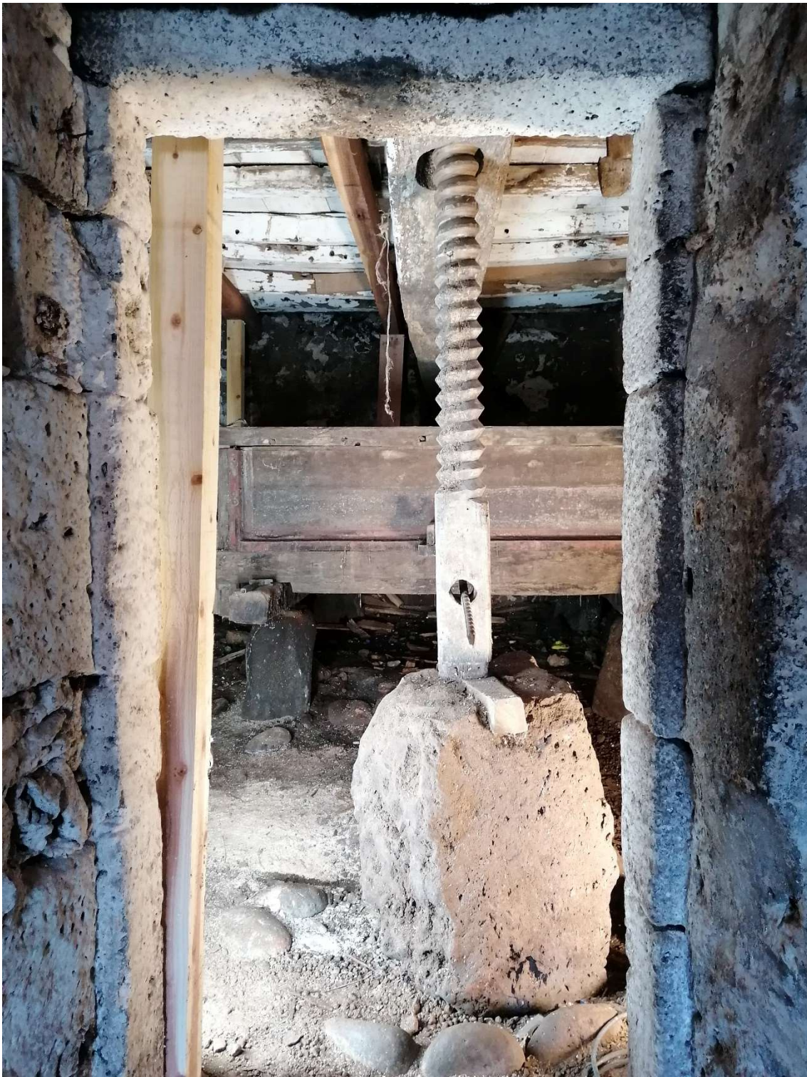
Figura 1: Museu do Pico, Entrada da Cave onde se encontrava o Lagar de Madeira, 8 de Outubro 2020