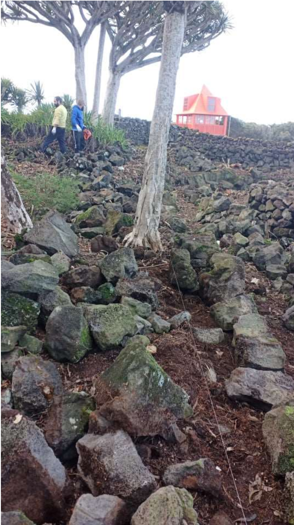
Figura 6: Museu do Pico, Muro de pedra basáltica antes da reconstrução, 20 de Janeiro 2021