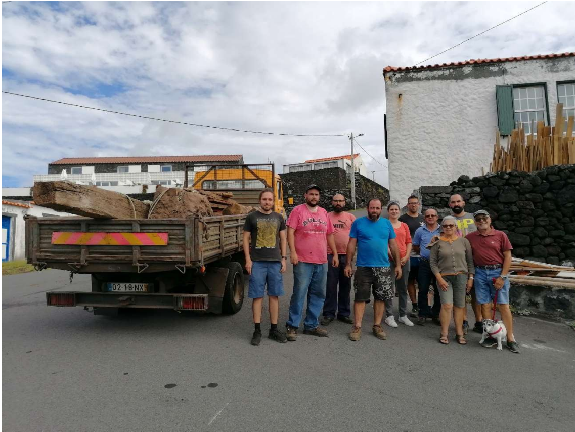
Figura 4: Museu do Pico, Lagar já desmontado e pronto para transportar ao lado dos proprietários e da equipa que o removeu, 8 de Outubro 2020