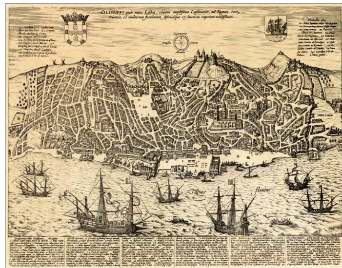
Fig. 10 – Lisboa numa gravura publicada por Georg Braun em Urbium Præcipuarum Mundi Theatrum quintum , c. 1598.

levantar a importante feitoria de São Jorge da Mina (1482), pelo que a instituição reguladora passou a ser designada só por Casa da Mina, embora apareça também chamada por Casa da Guiné ou por Casa da Mina e Tratos da Guiné, numa oscilação semântica nem sempre fácil de seguir. Com a inauguração da rota do Cabo por Vasco de Gama, em 1498, foi criada, por sua vez, a Casa da Índia, que, forte das especiarias orientais, abriu um chapéu principal onde se acolheu a Casa da Guiné, passando as designações mais correntes, mas não únicas, a ser as de Casa (ou Casas) da Índia e Guiné ou Casa(s) da Índia e Mina ou Casa(s) da Mina e Índias. Em 1500, numa altura em que, por causa da peste, a instituição, seguindo a corte, foi transferida temporariamente para Almada, o rei chamava-lhe “a nossa casa dos tratos de Guiné e Índias” (Meneses 1987, p. 10). Anos mais tarde, a deslocação do palácio real do sítio do Castelo para a Ribeira (onde foi inaugurado em 1505) vai transformar profundamente a zona baixa da Cidade e levará também a grandes obras de ampliação na Casa da Mina e Índias, chamemo-lhe assim. Será nessa altura que as duas repartições são desanexadas, passando a Casa da Índia e a