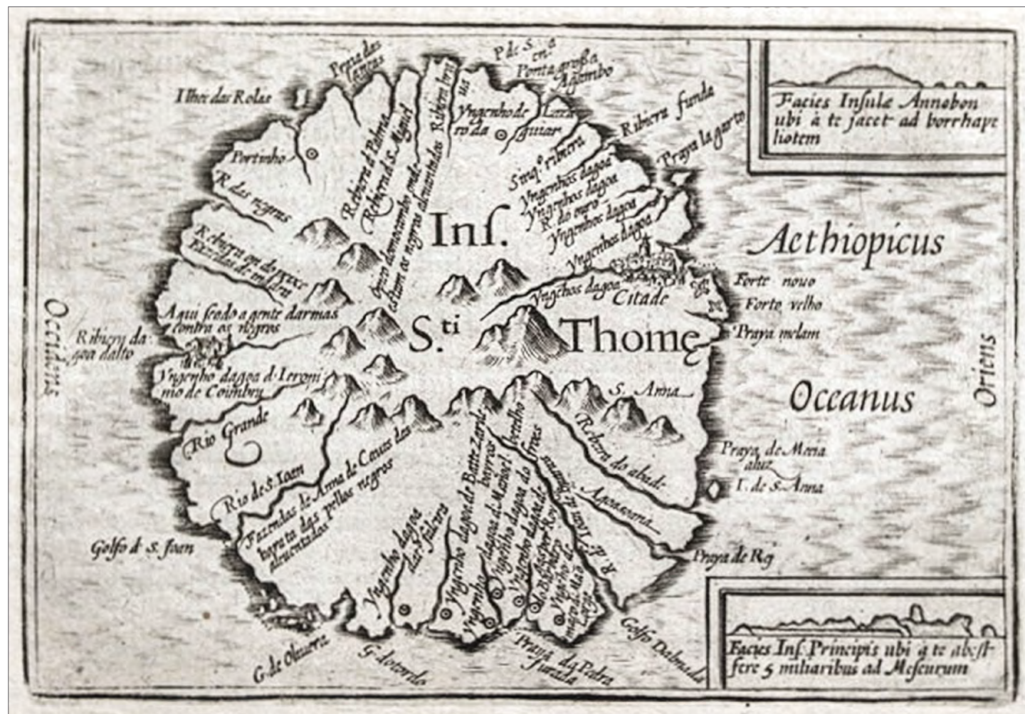
Fig. 7 – Ilha de São Tomé numa carta de Petrus Bertius, Amesterdão, 1606, de acordo com um padrão português de cerca de 1595

de escravos, a partir da década de 1520 passaram a ser as Caraíbas, conjuntamente com a Mina, a ocupar esse lugar. Por outro lado, a cana-de-açúcar levada da Madeira, adaptou-se muito bem nas ilhas de São Tomé e do Príncipe e, antes de meados do século XVI, o açúcar era já o principal produto de exportação. Apesar da importância do tráfico de escravos, a rota de São Tomé a Lisboa vai depender sobretudo do comércio do açúcar (Godinho 1990, p. 480) e só sobreviveu enquanto este sobreviveu.