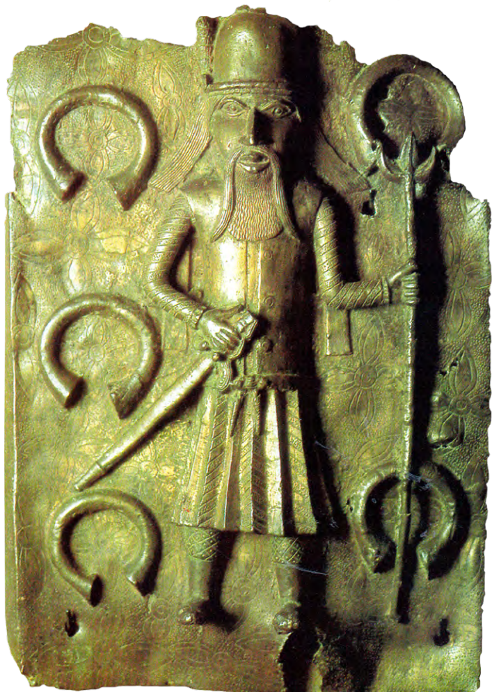
Fig. 6 – Placa de latão do Benim representando um soldado português. De cada lado, aparecem manilhas de cobre, uma das principais mercadorias com que eram comprados os escravos nesse reino do delta do rio Níger. Museum für Volkerkunde, Viena (Áustria). Finais do Séc. XVI.

de grupo de missionários. Aveiro levava outra incumbência: instalar em Uगतó uma feitoria, não fortificada, que tinha como principal objectivo assegurar o abastecimento de São Jorge da Mina em escravos, coris e outros produtos locais. Os resultados, porém, foram muito insatisfatórios e a feitoria não tardou a fechar portas, não existindo já em 1506. Para isso, contribuiu a insalubridade da região e as dificuldades de relacionamento com o oba , renitente na conversão o cristianismo e, ao que parece, muito constrangedor da actuação dos feitores, uma vez que