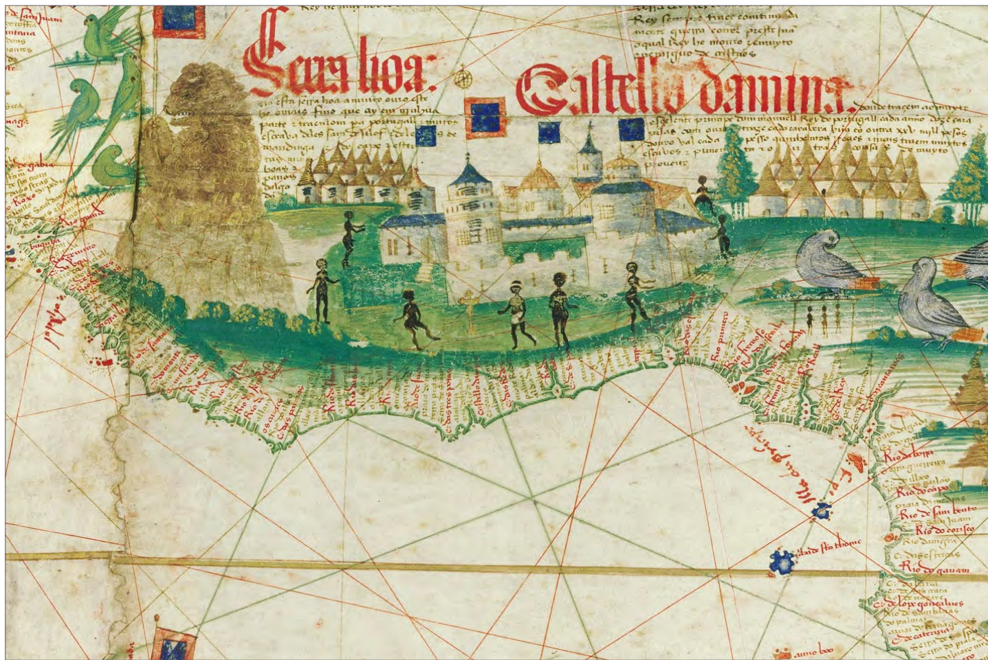
Fig. 4 – Pormenor do Golfo da Guiné no planisfério português anónimo concluído em outubro de 1502 em Lisboa, conhecido por “mapa de Cantino”. Biblioteca Estense e Universitaria, Modena.

que pudessem assegurar o fornecimento directo de escravos a Portugal teve outro insucesso na Serra Leoa. Chegou a edificar-se uma fortaleza no extremo ocidental da Serra, na margem do rio de Bintombo ou Mintombo (que é, na realidade um braço de mar) a cinco léguas da “foz”, “a qual depois por algumas causas [D. João II] mandou derribar”. Que causas fossem, Duarte Pacheco Pereira, que dá essa informação, não esclarece (1956, p. 80). Foi nestas circunstâncias que o arquipélago de Cabo Verde ganhou uma importância estratégica cada vez maior, como entreposto no tráfico de mão-de-obra escrava. As dez ilhas do arquipélago de Cabo Verde (todas