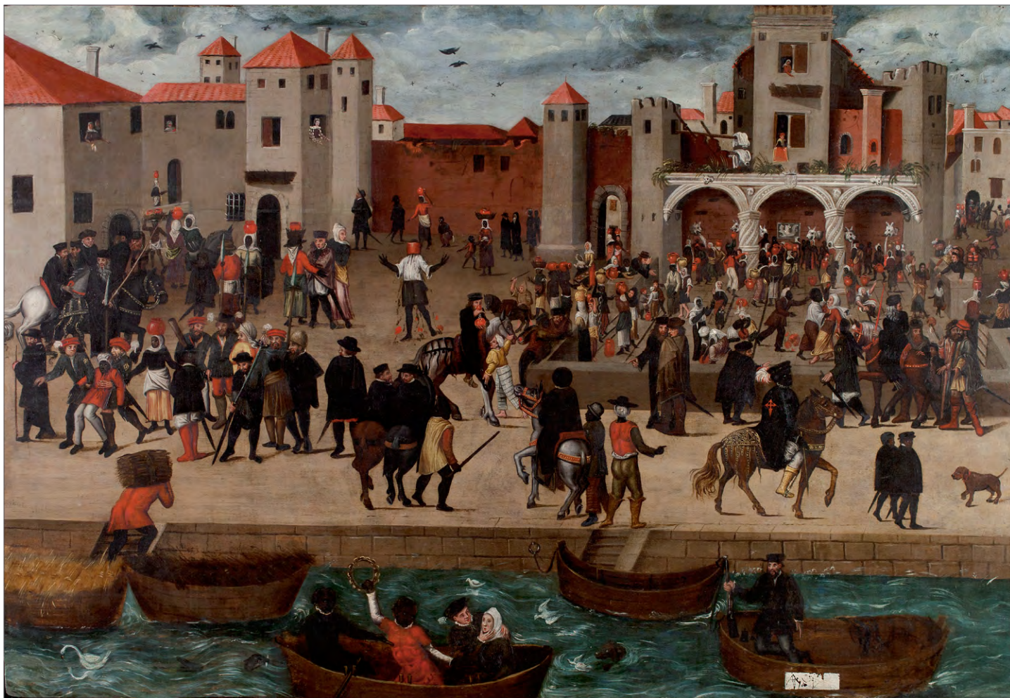
Fig. 13 – Chafariz Del-Rei, onde era frequente a presença de escravos negros. Pintura da Fundação Berardo, Lisboa.

proprietários ou pelos seus representantes, tão cedo quanto possível. Os que pertenciam ao rei, produto do “quarto” e da “vintena” ou que tinham sido trazidos à sua conta, ficavam na Casa dos Escravos, ao cuidado do almoxarife, até que ele os conseguisse vender. No entanto, o regimento recomendava ao feitor das Casas da Guiné e Índia que, até isso acontecer, os fosse “ver, visitar e curar de maneira que não morram nem se percam alguns, como muitas vezes acontece, por minguia de bom trato e cura”. Logo que curados, deviam ser avaliados e vendidos, “para não fazerem despesa na casa sem necessidade” (Peres 1947, p. 28-29 e 118).