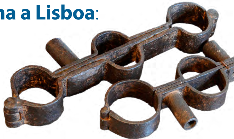
Fig. 1 - Grilheta de escravo