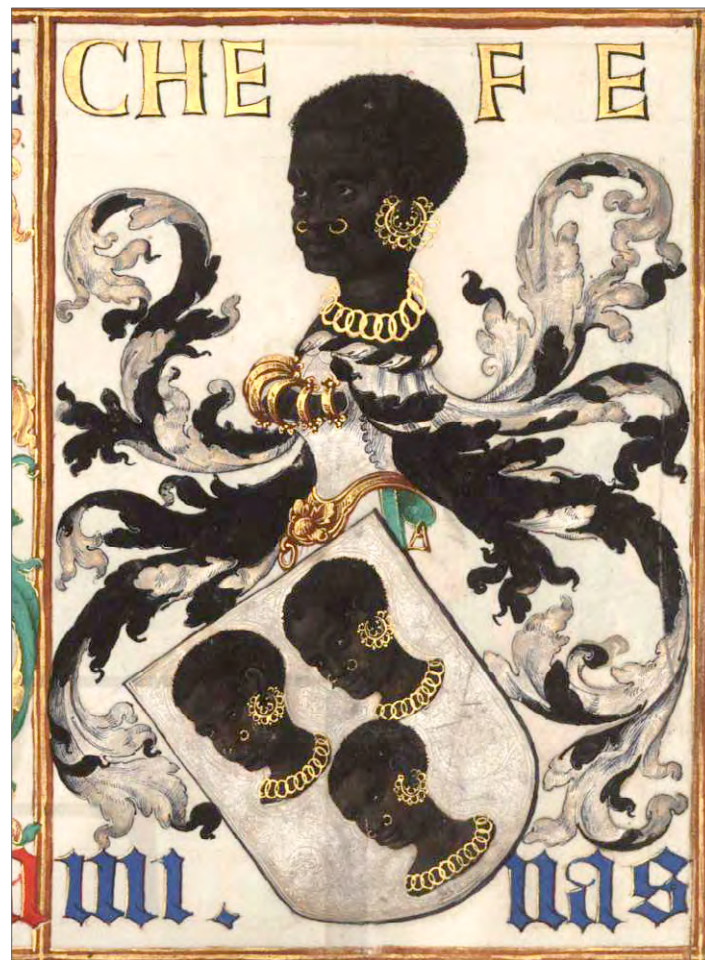
Fig. 5 – Brasão de armas de Fernão Gomes da Mina, onde figuram as “mercadorias” que tinham feito a sua fortuna: ouro e escravos africanos. Livro da Nobreza e Perfeição das Armas de António Godinho, c. 1518. Arquivo Nacional da Torre do Tombo, Lisboa.

No seguimento dos contactos estabelecidos por João Afonso de Aveiro, o oba do Benim enviou como embaixador a Portugal, talvez em 1484 ou 1486, o chefe da cidade do Uगतó ( Gwato ou Ughoton ), povoação com cerca de 2000 vizinhos, situada num dos braços do rio Formoso, uma das mais importantes escáfulas de escravos da região. O embaixador, “homem de bom repouso e natural saber”, no dizer de Rui de Pina, foi muito bem recebido por D. João II, tendo João Afonso de Aveiro sido encarregado de o levar de regresso a África, acompanhado já