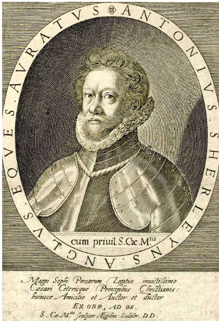
Fig. 1 – Retrato de Anthony Sherley em Praga, c. 1601-1605. / Portrait de Anthony Sherley à Prague c. 1601-1605 (The British Museum, P,1.169).