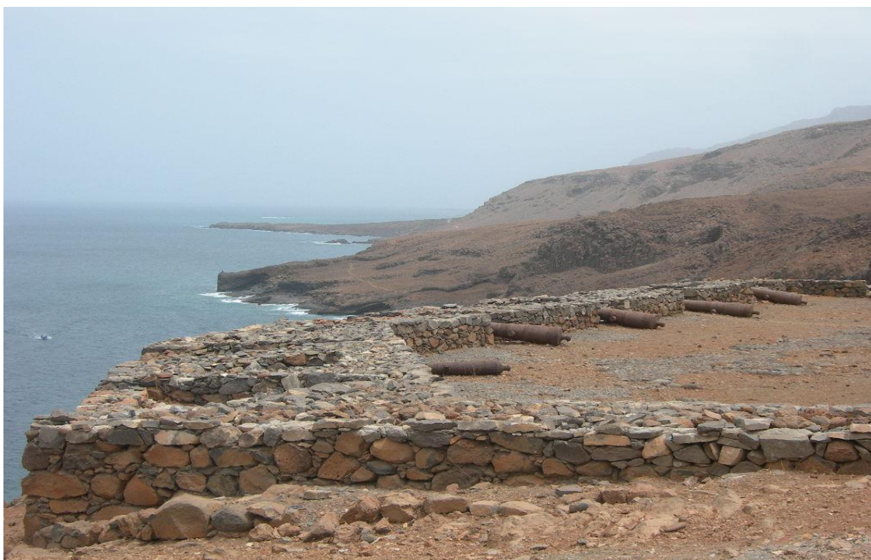
Panorâmica do Forte do Príncipe Real, na Preguiça, ilha de São Nicolau, após a sua “reconstituição”, levada a cabo em 1993, com canhões (encravados com projecteis de calibre superior e com o logótipo do fundidor, com o escudo português e a data de 1791) no seu interior.

Utilizando as palavras de Artur Teodoro de Matos, “o valor estratégico das ilhas de Cabo Verde marcou desde o início o seu destino: posto avançado no domínio do Atlântico, escala de abrigo e abastecimentos de navios que sulcavam o mesmo oceano [...]” 106 . Assim, em vários conflitos ocidentais, o arquipélago de Cabo Verde viu reforçada a sua função no Atlântico, numa conjuntura em que o Oceano funcionava como espaço fulcral .