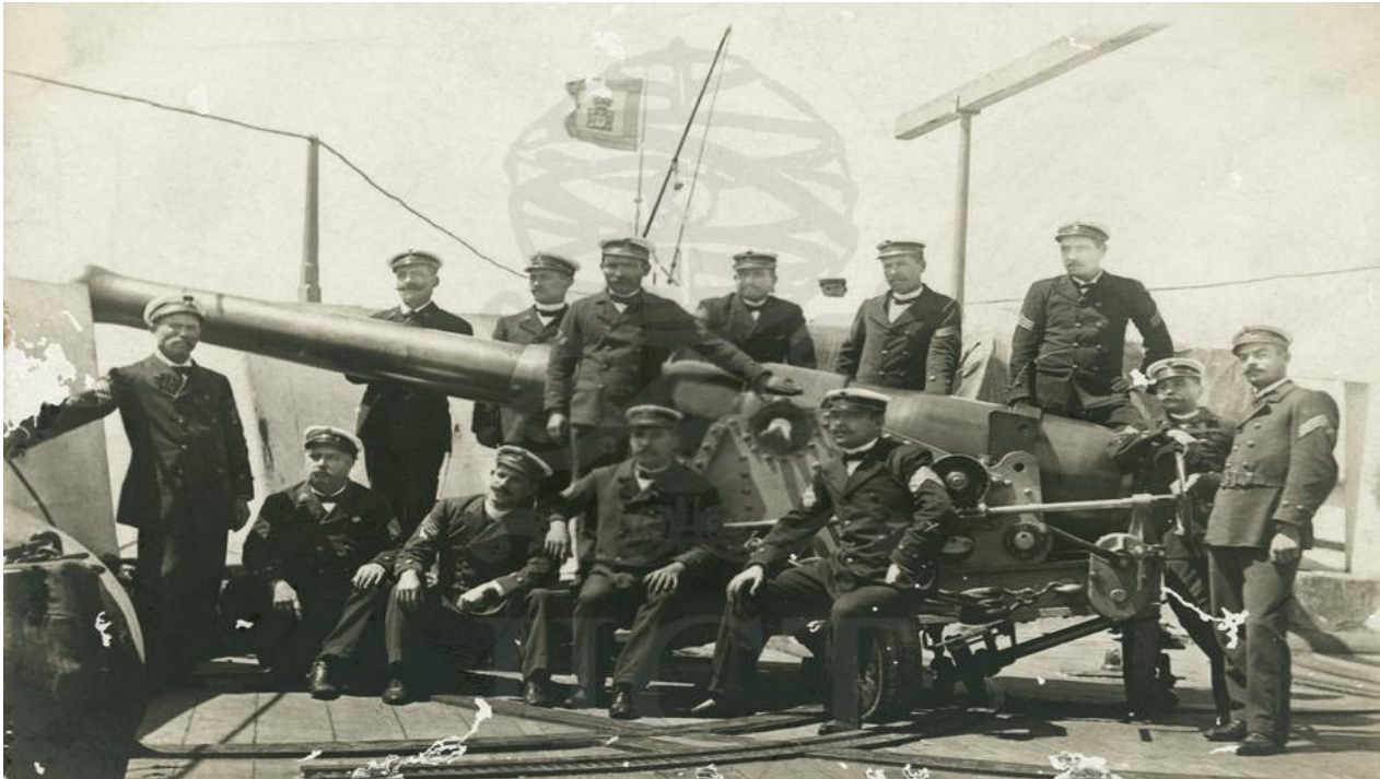
[Tripulação do navio de guerra] – Instituto de Investigação Científica Tropical.