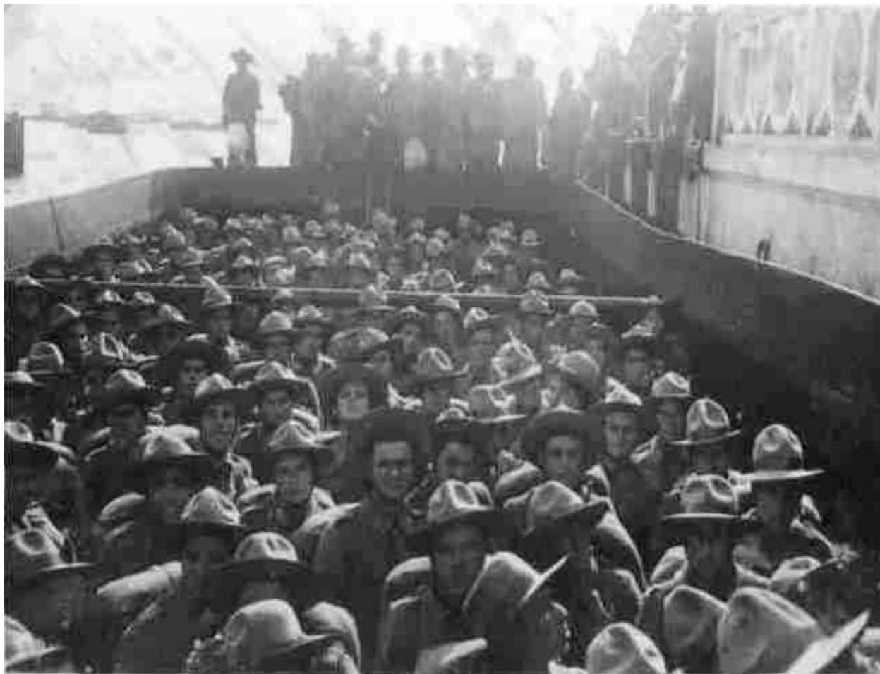
[Chegada do 1.º Batalhão Expedicionário do Regimento de Infantaria n.º 5 das Caldas da Rainha, a São Vicente, Cabo Verde, a 23 de Julho de 1941. No porto do Mindelo, foram “entusiasticamente recebidos”] 401 .

Segundo nos relata Luís Henriques 399 , a 23 de Julho de 1941 chegou a São Vicente, o 1.º Batalhão Expedicionário do Regimento de Infantaria n.º 5 e n.º 7 das Caldas da Rainha, com mil e tal homens. Outro corpo expedicionário que foi para Cabo Verde foi o do Regimento de Infantaria 11, de Setúbal 400 .