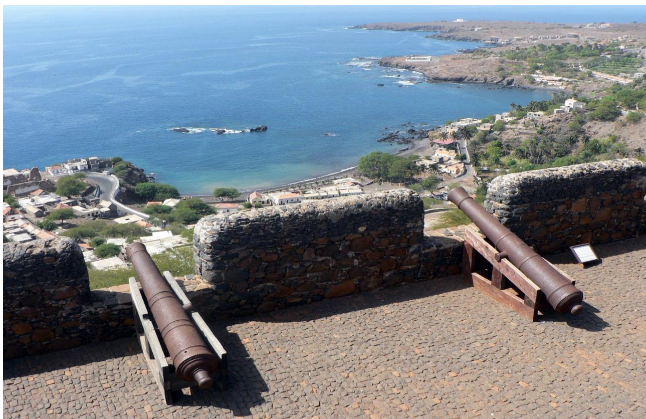
Fortaleza de São Filipe, Ribeira Grande (Cidade Velha), Ilha de Santiago

No canto noroeste do Forte, foi implantado, em 1993, o padrão comemorativo da passagem de Pedro Álvares Cabral por São Nicolau, aquando da sua viagem ao Brasil. À esquerda da imagem, visualizamos o Padrão comemorativo do quinto centenário do nascimento de Pedro Álvares Cabral, inaugurado em 1966. 107