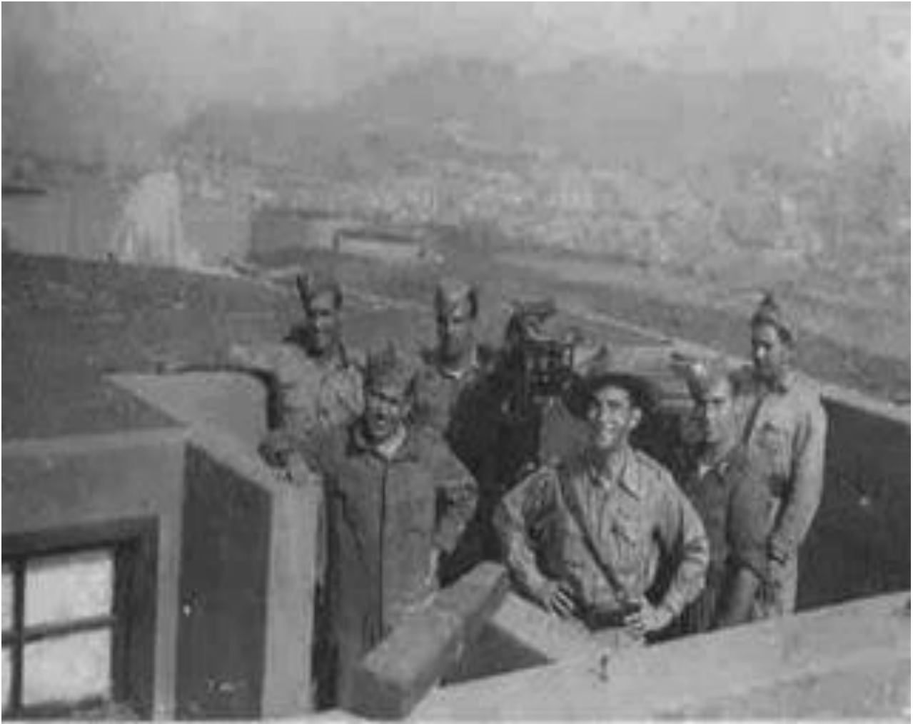
[Posição das peças anti-áreas no Monte Sossego, São Vicente, Cabo Verde, 21 de Março de 1943] 403 .

A 30 de Dezembro de 1940, dia seguinte ao seu discurso sobre as posições estratégica dos Açores e de Cabo Verde, Roosevelt proferiu ao Lord Halifax, embaixador britânico em Washington, que “[...] está a ser preparada uma força expedicionária de 25 000 homens [...] e está a pressionar as autoridades militares para acelerarem os preparativos [...]” 404 para a defesa desses dois arquipélagos.