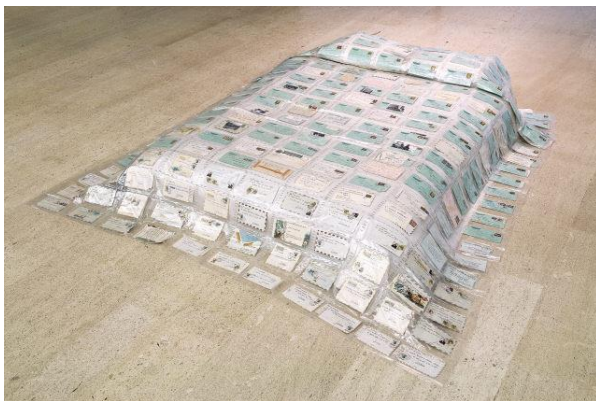
Fig. 2 - Ana Vidigal, Penélope , 2000.