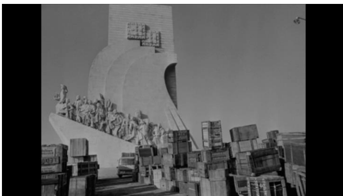
Fig. 18 - Ângela Ferreira, Colonialismo Sujo, Descolonização Selvagem , 2015.