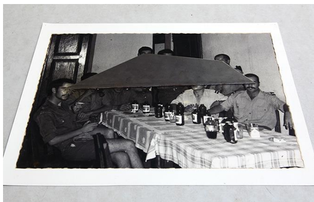
Fig. 8 - Daniel Barroca, Obstrução de Cumplicidades (Objetos em camadas #3) , 2011.