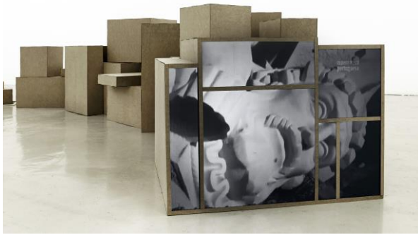
Fig. 16 - Ângela Ferreira, Colonialismo Sujo, Descolonização Selvagem , 2015. Vista da exposição Ressignificação , no Colégio das Artes, em Coimbra.