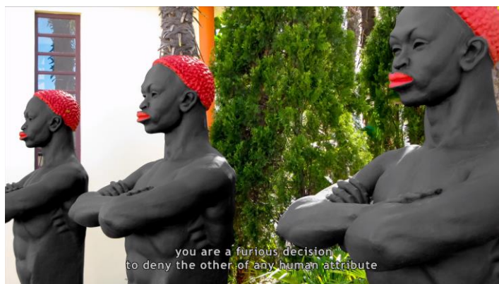
Fig. 19 - Vasco Araújo, Parque Temático , 2016.