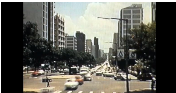
Fig. 15 - Maria Lusitano, Nostalgia , 2002.