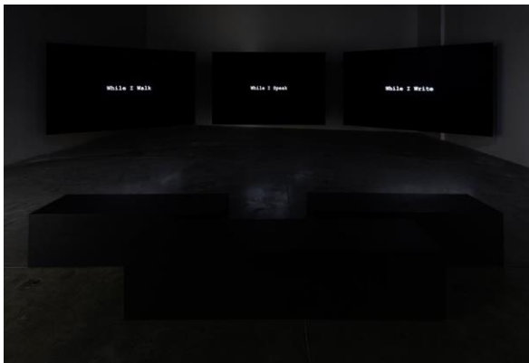
Fig. 23 - Grada Kilomba, The Desire Project . Vista da exposição Secrets do Tell , no The Power Plant, Toronto, 2018.