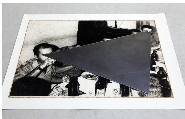
Fig. 9 - Daniel Barroca, Obstrução de Cumplicidades (Objetos em camadas #4) , 2011.