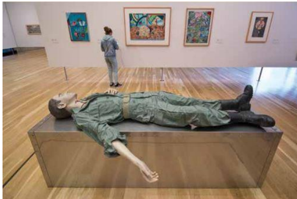
Fig. 1 - Clara Menéres, Jaz morto e arrefece o menino da sua mãe , 1973.