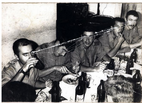
Fig. 6 - Daniel Barroca, Mapas de Cumplicidades #3 , 2011.