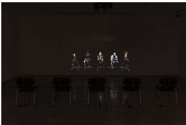
Fig. 24 – Grada Kilomba. Plantation Memories . Vista da exposição Secrets do Tell , no The Power Plant, Toronto, 2018.