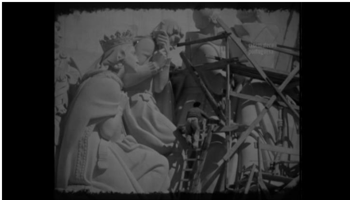
Fig. 17 - Ângela Ferreira, Colonialismo Sujo, Descolonização Selvagem , 2015.