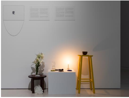
Fig. 22 – Grada Kilomba, Vista da exposição Secrets do Tell , no MAAT, 2017.