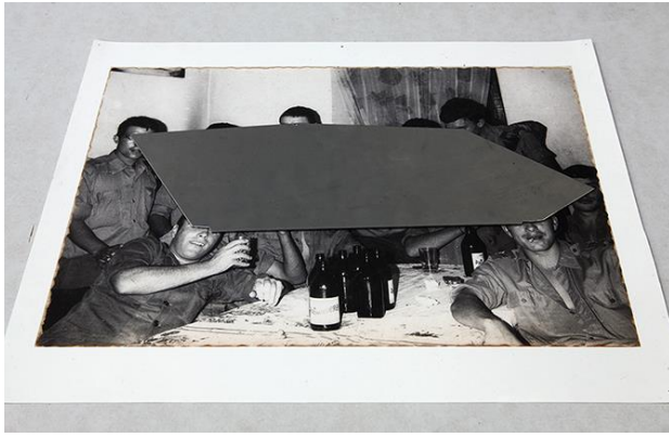
Fig. 10 - Daniel Barroca, Obstrução de Cumplicidades (Objetos em camadas #5) , 2011.