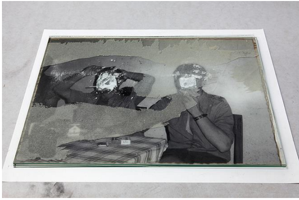
Fig. 13 - Daniel Barroca, Objetos em camadas #7 , 2011.