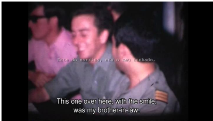
Fig. 14 - Maria Lusitano, Nostalgia , 2002. Fonte: https://www.marialusitano.org/nostalgia