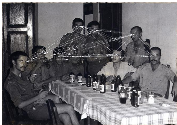
Fig. 5 - Daniel Barroca, Mapas de Cumplicidades #2 , 2011.