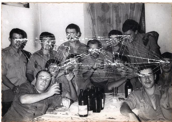
Fig.4 - Daniel Barroca, Mapas de Cumplicidades #1 , 2011.