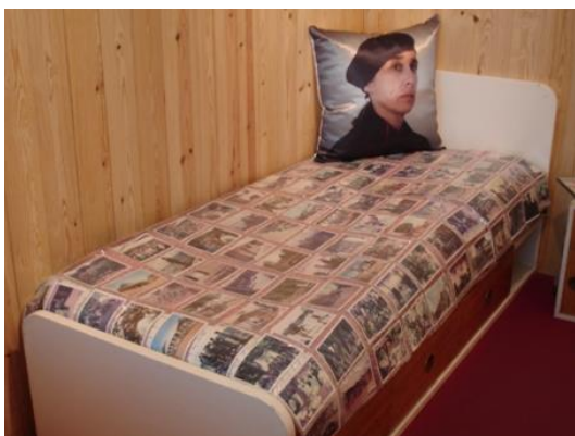
Fig. 3 - Ana Vidigal, Void , 2007.