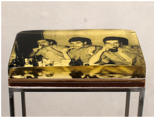
Fig. 11 - Daniel Barroca, Objetos em camadas #1 , 2011.