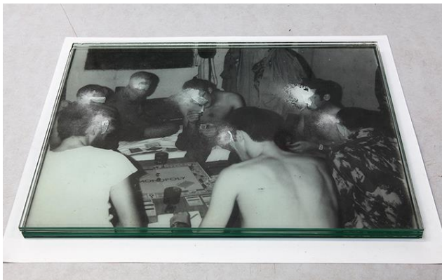
Fig. 12 - Daniel Barroca, Objetos em camadas #6 , 2011.