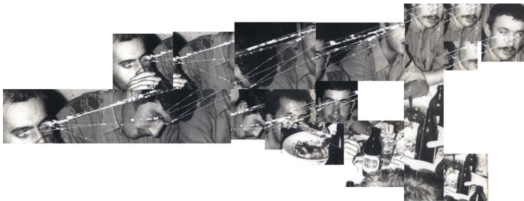
Fig. 7 - Daniel Barroca, Reconfiguração de uma linha raspada , 2011. Fonte: http://danielbarroca.net/reconfiguration-of-a-scratched-line/