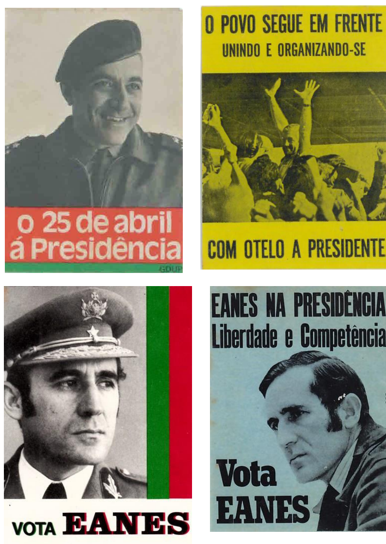
Fig. 1 - os dois perfis na propaganda de cada um dos candidatos

eleitores se poderiam rever. Estes elegeriam, assim, um futuro diferentemente estetizado ou, no limite, eleger-se-iam a si mesmos, identificando-se indistintamente com um dos modelos oferecidos. O que poderia diferenciar esses processos de identificação seria “o grau de distanciamento entre o ego e o ideal do ego” 215 – isto é, entre a imagem de si e a imagem de si a partir de uma representação idealizada. Se essa distância for grande, o ideal do ego pode transferir-se por inteiro para o líder do grupo, ao passo que se for diminuta o líder poderá ser escolhido pelo grupo enquanto parte do grupo, participando no processo geral de identificação mútua. Também a essa luz se pode pensar a “distância” cultivada por Eanes e a “proximidade” de Otelo – bem como os seus diferentes apelos.