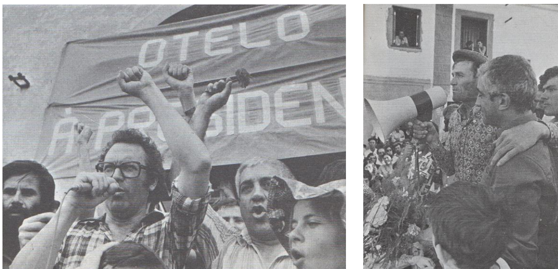
Fig. 3 – Início da oficial da campanha em Grândola, cantando a canção homónima ao lado de Zeca Afonso e empunhando um cravo (sumário do imaginário de Abril). À direita, no Alentejo, foto legendada “o trabalhador e o candidato dos trabalhadores” 271

Por sua vez, a campanha de Eanes procurou um outro tipo de evocações, sendo a primeira paragem um regresso à sua terra natal, Alcains. Não pondo de lado as motivações sentimentais de tal opção, tratava-se igualmente de colocar as suas origens ao serviço dos elementos-chave do seu discurso, apresentando-o como um “homem como os outros”, de origens modestas e de uma terra habituada ao trabalho e por ele disciplinada. Isto para além de, com esse regresso a casa, se poder compor uma imagem mais familiar e humana de um general que, para muitos, permanecia demasiado distante. Dirigindo-se aos seus conterrâneos, garantia não se dizer “filho do povo para demagógicamente o influenciar. Sou-o de facto. E vós o sabeis.” 272 Em suma, tratava-se de o aproximar de um modelo de perseverança que a sua condição beirã ilustraria exemplarmente, constituindo um exemplo a ser emulado, num momento em que todos eram convidados a participar do processo de reconstrução nacional 273 . Não deixaria também de fazer referência à sua