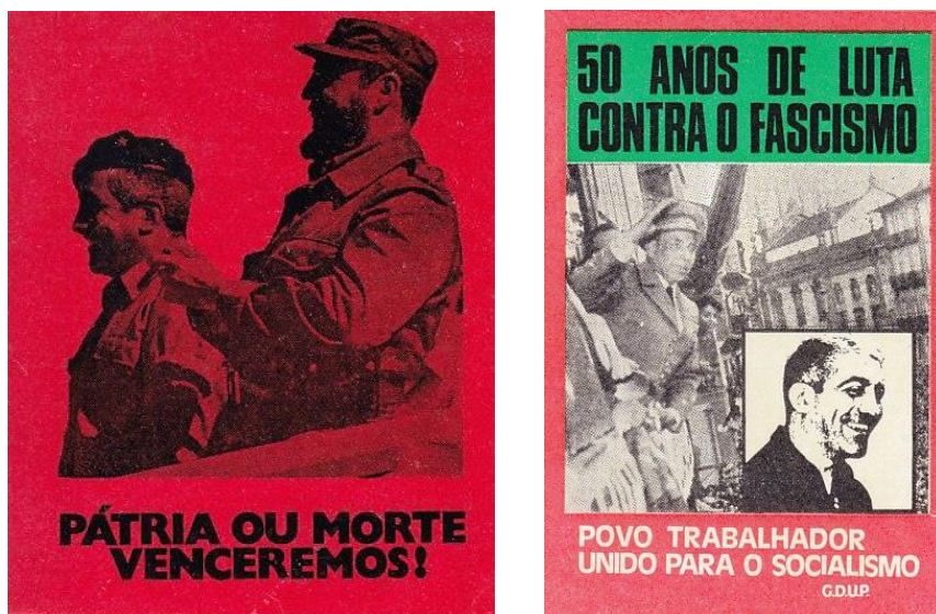
Fig. 2 – As “filiações” de Otelo em dois autocolantes da sua propaganda (Fidel Castro e Humberto Delgado) 269

Além disso, ao iniciar a campanha no norte do país, demonstrava também que a sua capacidade de mobilização era mais expressiva do que muitos antecipavam, comprovando que, nas palavras do próprio, “o Norte não é reaccionário”, levando mesmo os mais cépticos a afirmar que, afinal, “o movimento popular está longe de estar moribundo” 270 . O início oficial da campanha seria, no entanto, reservado para Grândola, por razões de ordem simbólica óbvias.