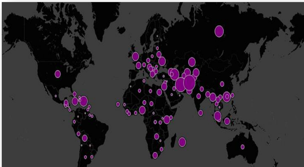
FIG. 03 - PREVALÊNCIA DE HEROÍNA NO MUNDO EM 2012

Fonte: Nações Unidas, 2012. Figura criada por Andy Cotgreave cit in Jornal The Guardian , edição de 2 Julho 2012 47 .