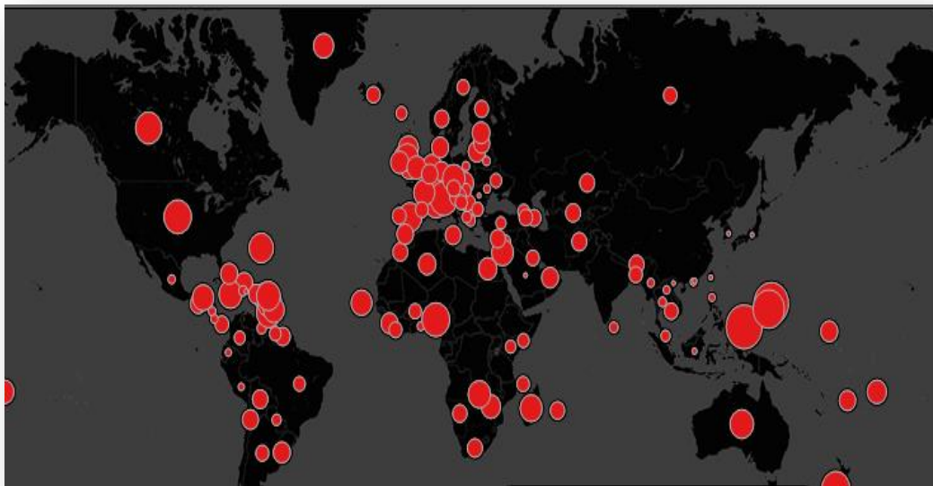
FIG. 04 - PREVALÊNCIA DE CANÁBIS NO MUNDO EM 2012

Fonte: Nações Unidas, 2012. Figura criada por Andy Cotgreave cit in Jornal The Guardian , edição de 2 Julho 2012 52 .