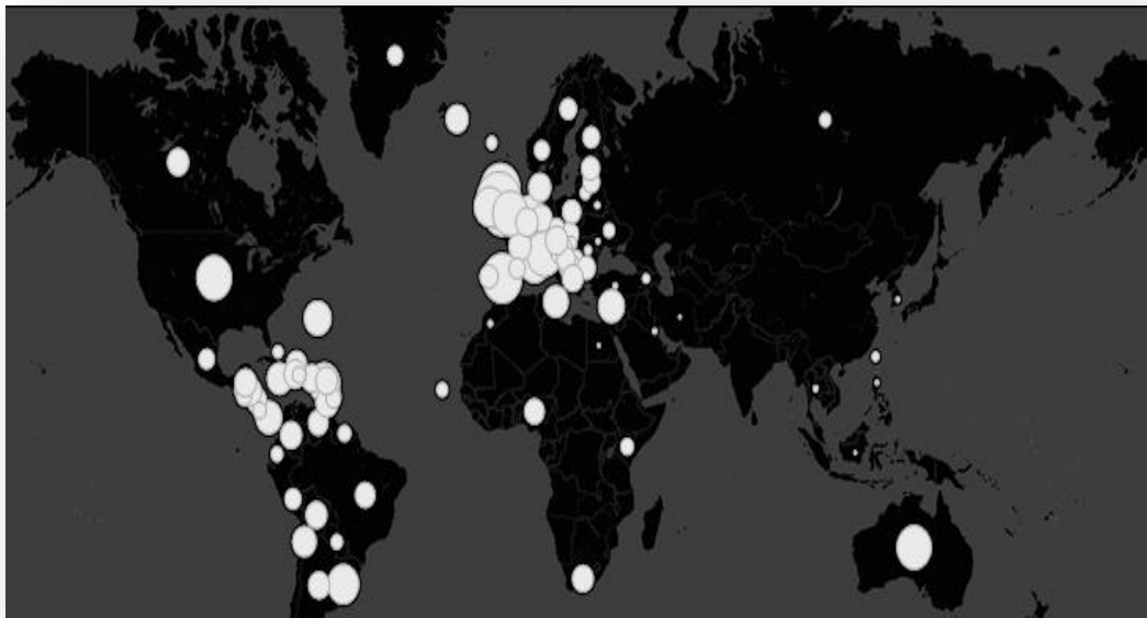
FIG. 05 - PREVALÊNCIA DE COCAÍNA NO MUNDO EM 2012

Fonte: Nações Unidas, 2012. Figura criada por Andy Cotgreave cit in Jornal The Guardian , edição de 2 Julho 2012 55 .