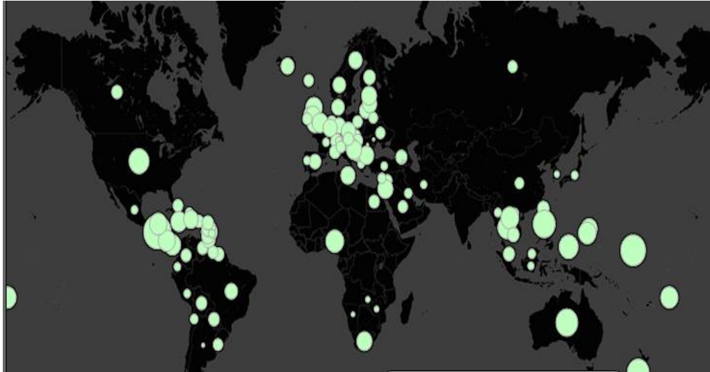
FIG. 06 - PREVALÊNCIA DAS ANFETAMINAS NO MUNDO EM 2012

Fonte: Nações Unidas, 2012. Figura criada por Andy Cotgreave cit in Jornal The Guardian , edição de 2 Julho 2012 59 .