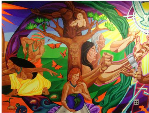
Imagem 3 - Pintura

Protecção do ambiente Liberdade Importância da mulher Força Fé Divindade Felicidade Amor Paz Alegria Harmonia Celebração Magia Solidariedade