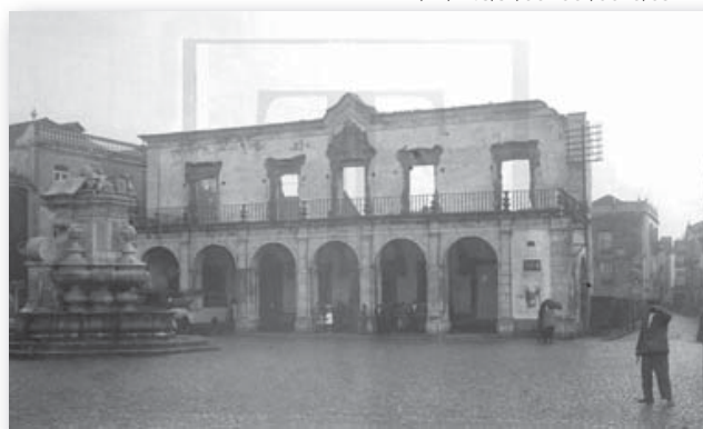
Ruínas dos antigos Paços do Concelho, O Século , 24/8/1931

ANTT-ARQUIVO NACIONAL DA TORRE DO TOMBO: PT/TT/EPJS/SF/001-001/0020/0972F