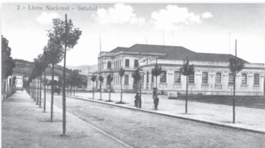
Liceu de Bocage, onde funcionou a Câmara Municipal desde o incêndio, em 1910, até 1939

reconstrução. Nesse sentido, em 29 de março de 1933 foi publicado o Decreto-lei n.º 22.378, cujo preâmbulo sublinhava as impossibilidades económicas do município e a tutela das obras por parte do Estado. Como contrapartida, o município abdicava do antigo edifício do Liceu de Bocage em favor do Estado. As obras arrancaram pouco depois, tendo apenas ficado concluídas no final de 1938.