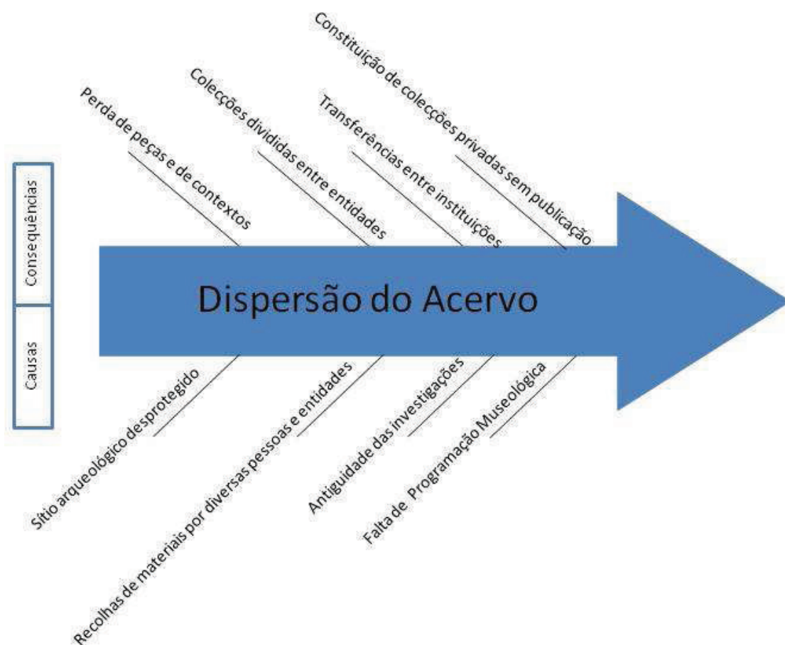
Fig. 3 - Causas e consequências da dispersão do acervo.

O presente caso de estudo é assim composto por um grande volume de acervo móvel disperso por diversas entidades. Esta dispersão está relacionada com a própria antiguidade das investigações e a origem do investimento para as escavações no sítio, mas sobretudo com a falta de determinação de um projeto museológico para este sítio arqueológico. A multiplicidade de entidades que o salvaguardam dificulta trata-lo como um conjunto único. São distintos os seus tratamentos a nível de inventário, havendo colecções bem documentadas, como é o caso do Gabinete de Arqueologia de Mafra e outros casos nos quais as peças não estão tão pouco marcadas.