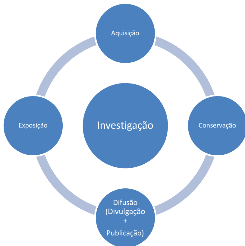
Fig. 4 - Funções museológicas a aplicar ao acervo diagnosticado.

Uma das funções museológicas de extrema importância em Tróia e que foi descurada durante séculos é a conservação , sendo que segundo o Art. 4º da Carta de Veneza, “a conservação dos monumentos exige, antes de tudo, manutenção”. Esta é uma das preocupações da actual equipa de arqueologia que cuida do sítio arqueológico. Para além, do sítio no geral estar exposto às condições naturais que o rodeiam, uma parte da estação arqueológica é diariamente perturbada pela erosão das marés na extensão deste povoado ao longo da orla do estuário do Sado. Por outro lado, a excepcional conservação das estruturas e dos depósitos protegidos pelas areias e do acervo móvel daqui resultante fazem deste sítio um local de conhecimento potencialmente crescente.