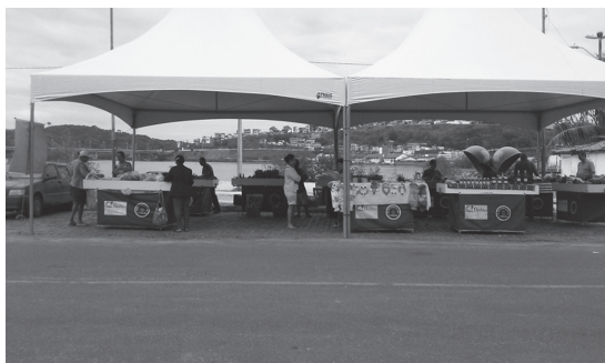
Figura 2 ▶ Feira Agroecológica em Ilhéus, 2015.

O local destinado foi o centro histórico da cidade, onde nas décadas de 1960-1970 era realizada uma feira de compra e venda de produtos agrícolas, de utensílios domésticos, roupas entre outros artefatos, no entanto, em um modelo diferente do atual. A feira agroecológica é realizada no centro histórico de Ilhéus, na Avenida Dois de Julho, ocorrendo todos os sábados, também no horário matutino, atualmente em espaço cedido por comerciantes locais que apoiam a iniciativa.