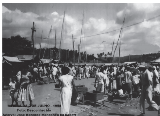
Figura 1 ▶ Feira Livre em Ilhéus em 1958

A primeira feira de produtos de base orgânica da cidade de Ilhéus foi uma iniciativa da parceria entre a Universidade Estadual de Santa Cruz (UESC) e o Instituto Cabruca, organização não governamental que atua junto a assentamentos de reforma agrária e comunidades tradicionais a partir da Assistência Técnica Rural. A organização de uma atividade prática, objetivando os desdobramentos teóricos do