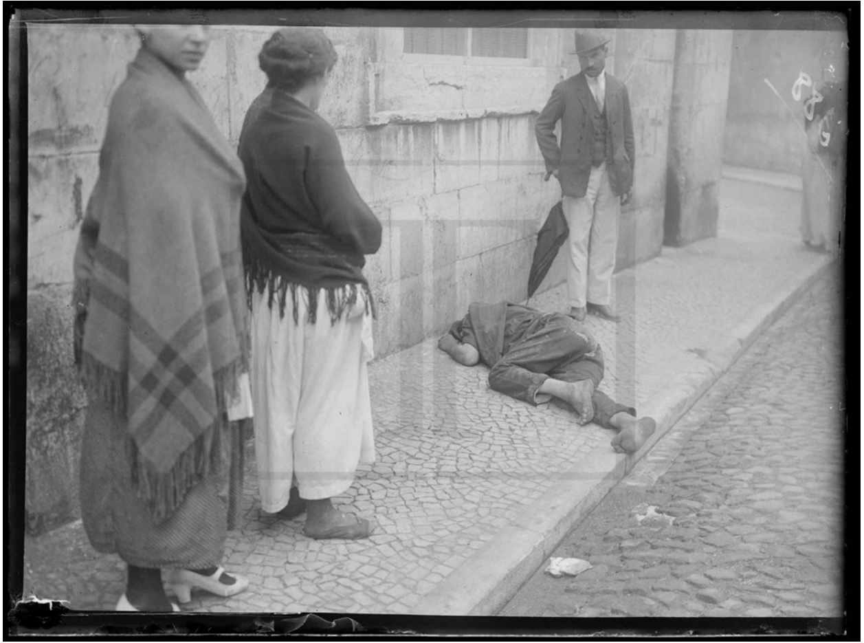
Figura 3 - Caído com Fome numa das Ruas de Lisboa - 1921