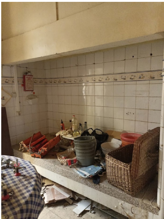
Figura 4 - Casa de Acumulador em Lisboa.