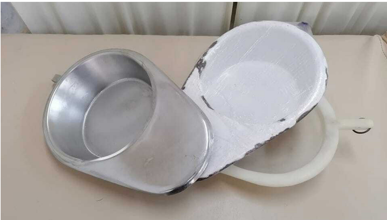
Figura 2 – Conjunto de Arrastadeiras.