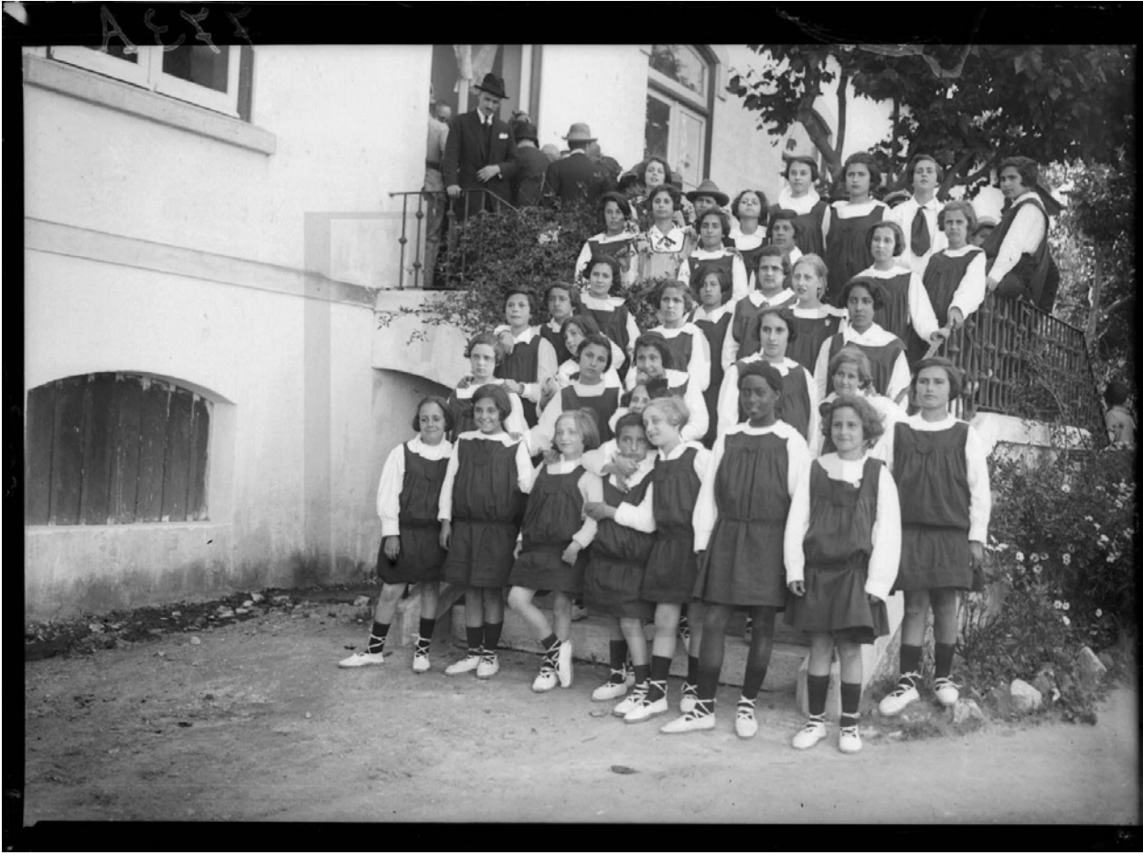
Figura 1 – As Crianças de Alcântara na Tapada da Ajuda – 1926.