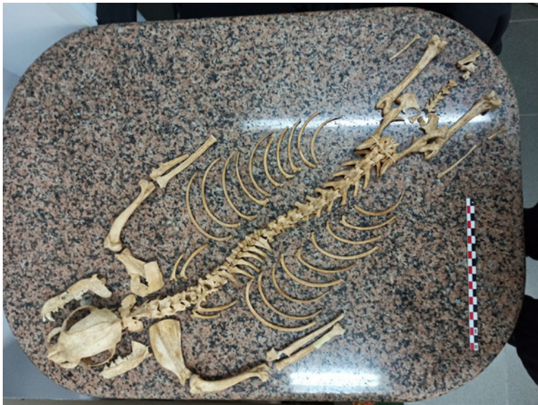
Figura 6 – Ossadas de Canídeo Encontradas no Nº12 da Rua do Vale.