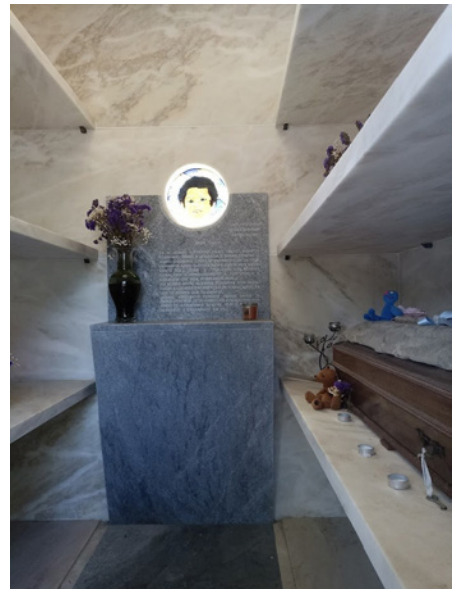
Figura 7 – Jazigo Familiar no Cemitério da Ajuda (Fotografia de Tânia Casimiro).