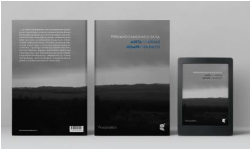
Anexo nº 11. Agita as águas Rompe o Silêncio