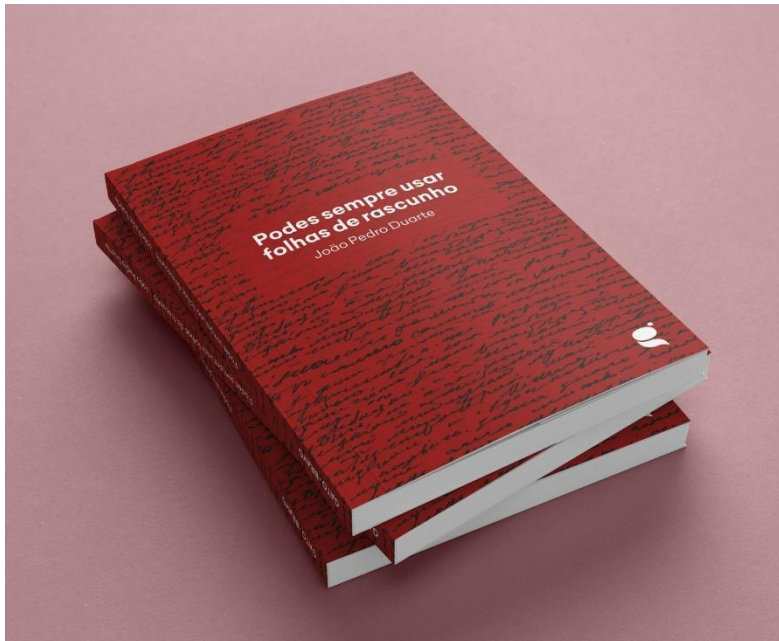
Anexo nº10. Podes sempre usar folha de rascunho

Simi, R. (2025). De volta para o passado . Editora Jaguatirica.