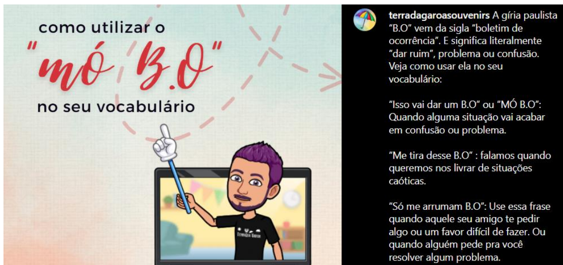
Anexo nº9. Post de Instagram. BO.