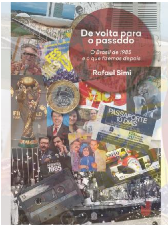
Anexo nº12. De volta para o passado