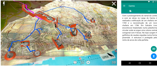
(a) Vários elementos virtuais sobre um mapa turístico de Lisboa: Cartografia, traçado e representações 3D