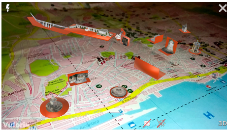
(c) Pormenor das representações 3D sobre o mapa