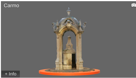
(e) Vista de detalhe da representação 3D