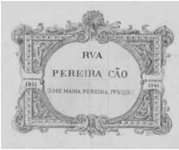
Fig. 2 Croquis da autoria de Victoria Pereira, datado de 1941, para o painel de azulejos da Rua Pereira Cão. Coleção particular.