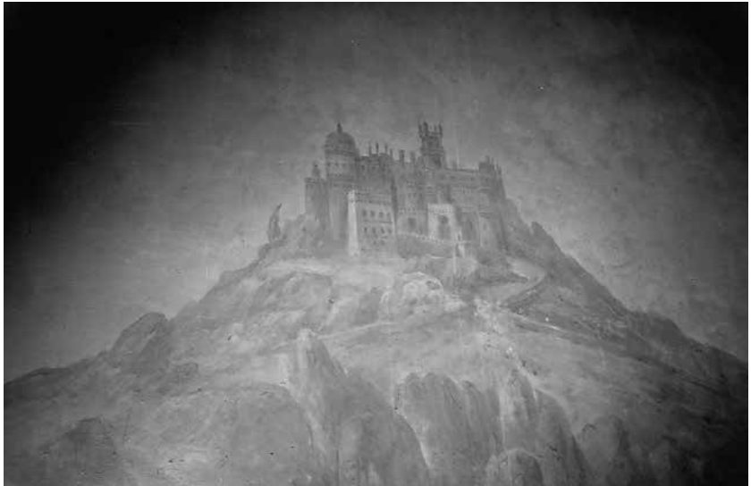
Fig. 9 Vista do Palácio da Pena. Pintura mural da escadaria do Palacete Alves Machado. Pereira Cão, 1889.