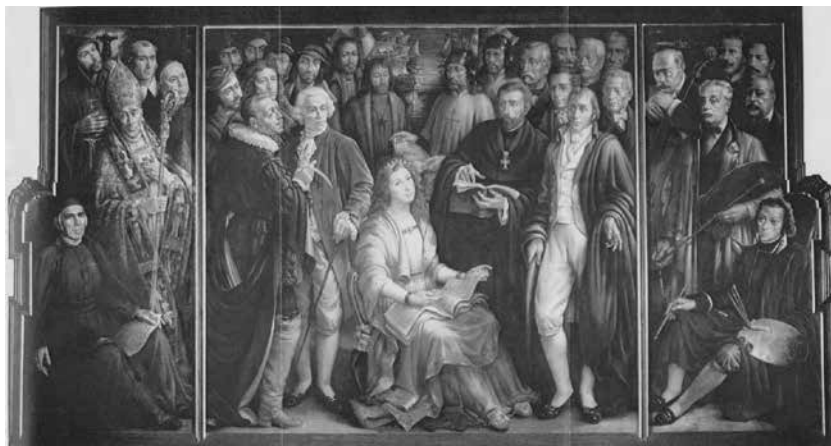
Fig. 1 Tríptico dos Notáveis de Setúbal, Luciano dos Santos. Salão Nobre dos Paços do Concelho de Setúbal.