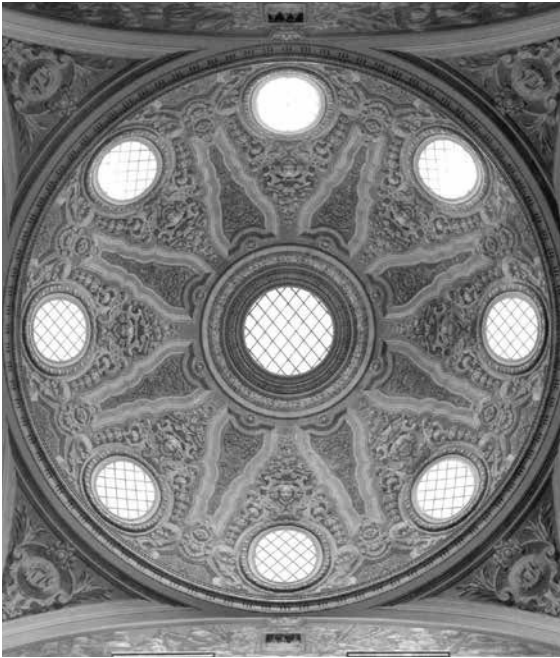
Fig. 5 Cúpula dos Paços do Concelho de Lisboa. Pintura ornamental, a claro-escuro, da autoria de Pereira Cão. À volta do brasão da cidade, que está pintado sobre as quatro redes de ventilação, podem observar-se os quatro tímpanos, com representações alegóricas - a Navegação; a Agricultura; o Comércio e a Indústria - pintados por Columbano Bordalo Pinheiro. 1880.