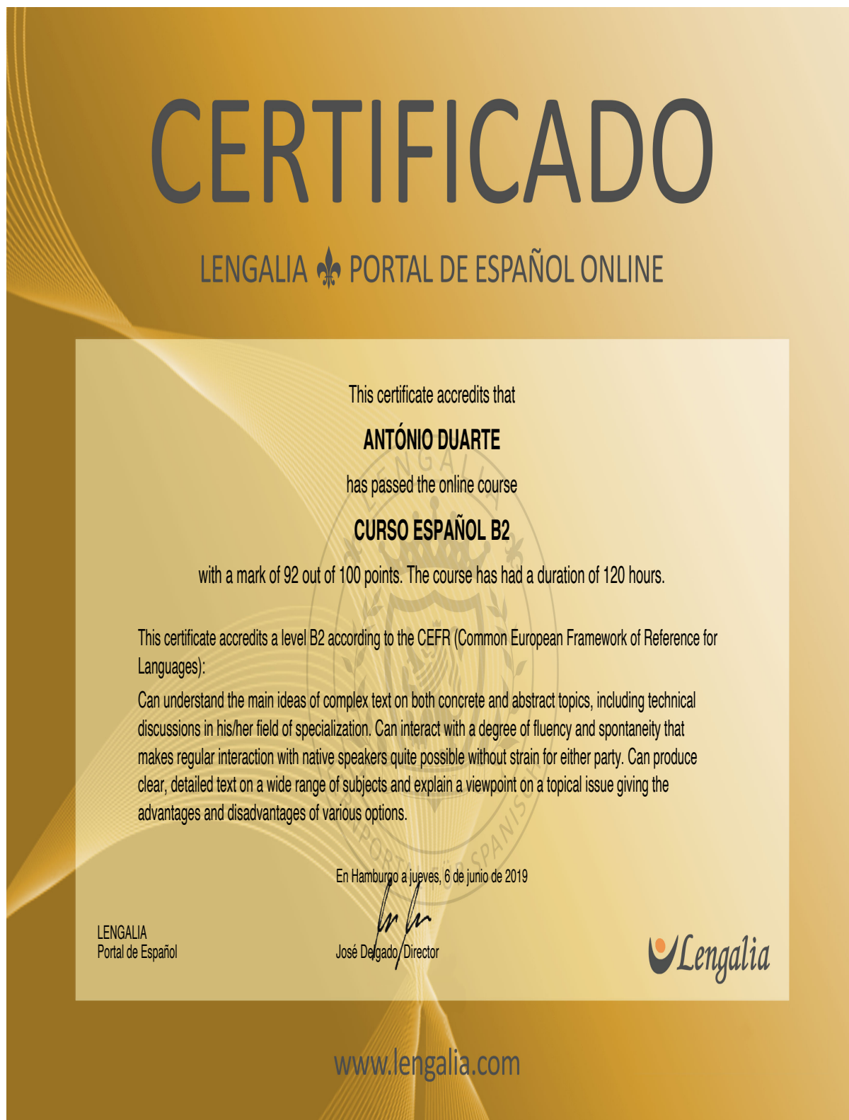
Figura 6-8: Certificado de língua espanhola grau B2.