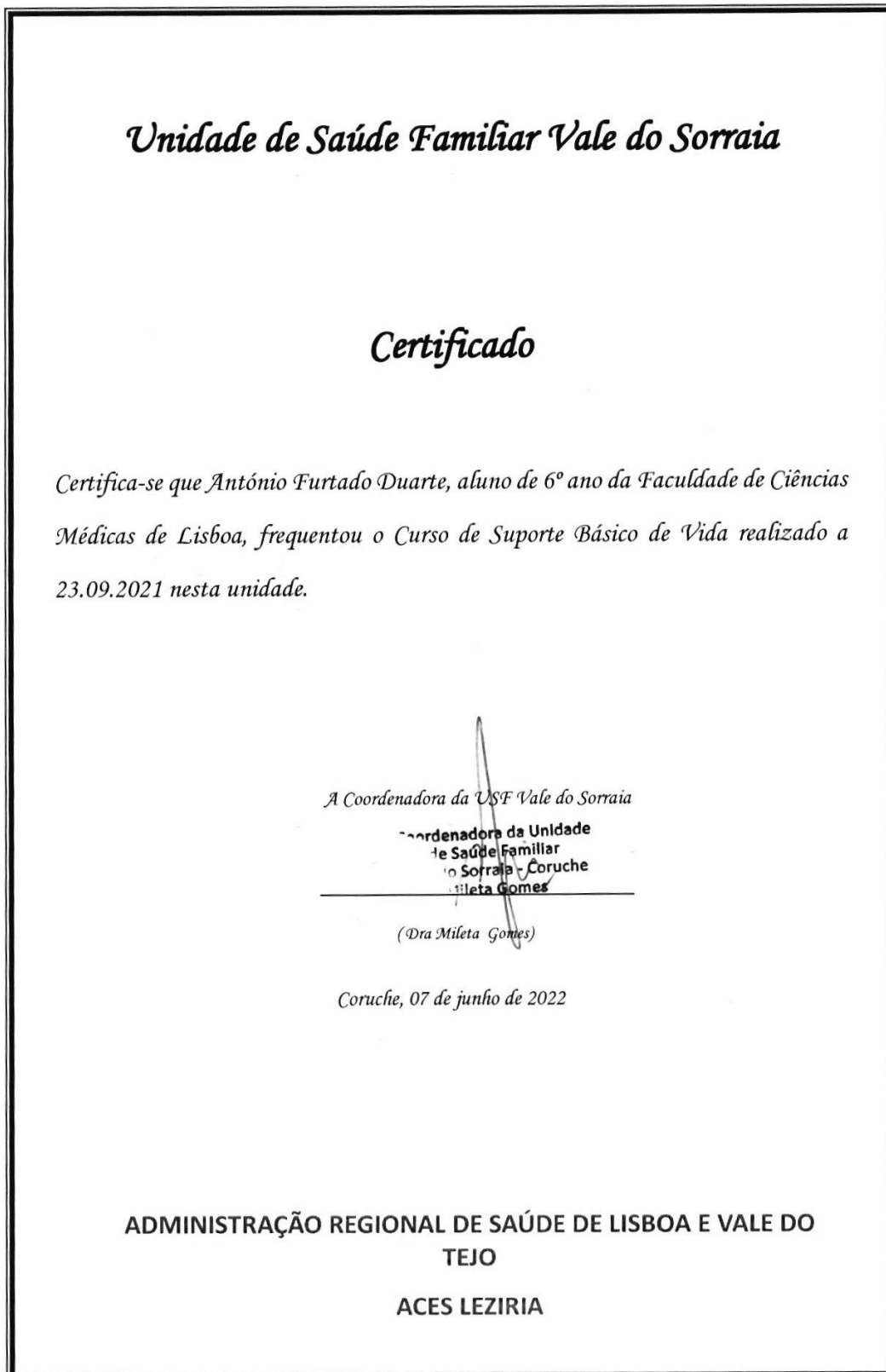
Figura 6-1: Certificado de realização do curso de suporte básico de vida.