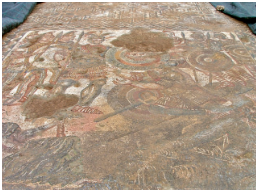
MOSAICO DA CASA DA MEDUSA COM REPRESENTAÇÃO DE UMA CENA DO CANTO XII DA ENEIDA DE VÍRGILIO. ALTER DO CHÃO. 2009.