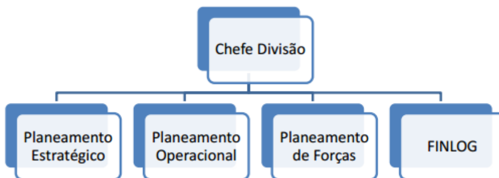
Figura III – Organograma da DIVPLAN identificando as áreas (FI EMA: 11)

Por fim, segundo o Artigo 14.º do RI EMA, às áreas compreendem os núcleos, aos quais compete “desenvolver os processos no âmbito das respetivas competências da divisão, nomeadamente elaborar estudos, planos, informações, pareceres ou propostas.”