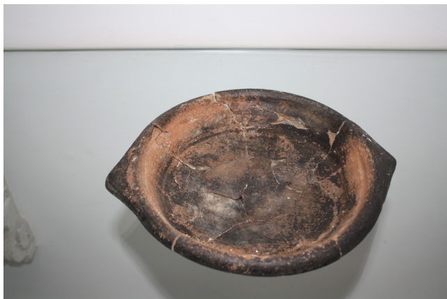
Fig. 5 - Frigdeira ou tigela de fogo

De notar em todos os documentos a referência a tigelas que iriam ao fogo, que suspeitamos terem a forma de uma frigdeira sem asas. A sua funcionalidade é variada. Na receita de almôndegas do Receitas de Cozinha estas iguarias colocam-se em hua tigella de agoa q' este feruendo, e temperada com a 3ª parte de sal atte q' se cosão (RCFP, 126). Na receita de tigelada de perdizes " tenhase cebola afogada, com aseite, ou manteiga, deite' tudo na tigella de fogo com seus adubos " (RCFP 138). Já na receita de Tigellada de queixo surge referência a uma tigella de frigir noua (RCFP, 322). Na receita de carneiro assado em água na mesma tigela onde se coze, leva-se a carne ao forno (RCFP, 380). Na Arte da Cozinha a sopa ou potagem à Franceza faz-se refogando dois pombos e duas perdizes numa tigela (AC, 6). No Livro de Cozinha da Infanta D. Maria ali se refogam carnes (LCI, 11). Se dúvidas existissem que estas tigelas eram todas em barro veja-se a receita de Pastel de Perna de Carneiro na Arte da Cozinha em que o dito recipiente, depois de virado ao contrário é quebrado. Nas Receitas de Cozinha (RCFP, 372) os Toresnos la'preados são colocados numa casuela depois de fritos, assim como os Pombos afogados (RCFP, 376).