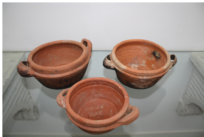
Fig. 3 e 4 - Tachos

As frigideiras (Fig. 1 G; Fig. 5) são parcamente mencionadas e associadas sempre a fritos ou ao acto de frigar, mas também podem ir ao forno. Apresentam formas hemisféricas, paredes mais baixas que os tachos e pegas triangulares ou um cabo tubular. Na Arte da Cozinha é utilizada no forno na receita de Sopa de Queijo com Lombo de Porco (AC, 5). Na receita de peixe frito aquele é feito numa sertã “ deitarselhea na sertã de asite q'estara feruendo, e espannado o peixe se lancará na certã. ” (AC, 186), assim como a filhós e beilhós (AC, 206). Tal como ocorre para as panelas e tachos também aqui surgem referências a peças de diversos tamanhos com a nomeação de uma frigideirinha.