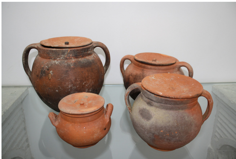
Fig. 2 - Panelas

Arqueologicamente são peças muito frequentes e em alguns contextos arqueológicos domésticos. Formas semelhantes são encontradas na área da grande Lisboa, mas também por todo o país (DIOGO e TRINDADE, 1998; CASIMIRO, 2011; BARBOSA, CASIMIRO e MANAIA, 2009; FERNANDES e CARVALHO, 1997; GOMES e GOMES, 1997; GOMES et al , 2013; REGO e MACIAS, 1993; RODRIGUES et al , 2013) e mesmo fora de Portugal (MARTIN, 1979).