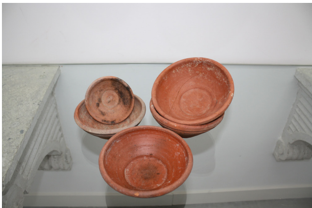
Fig. 6 - Taças e Tacinhas