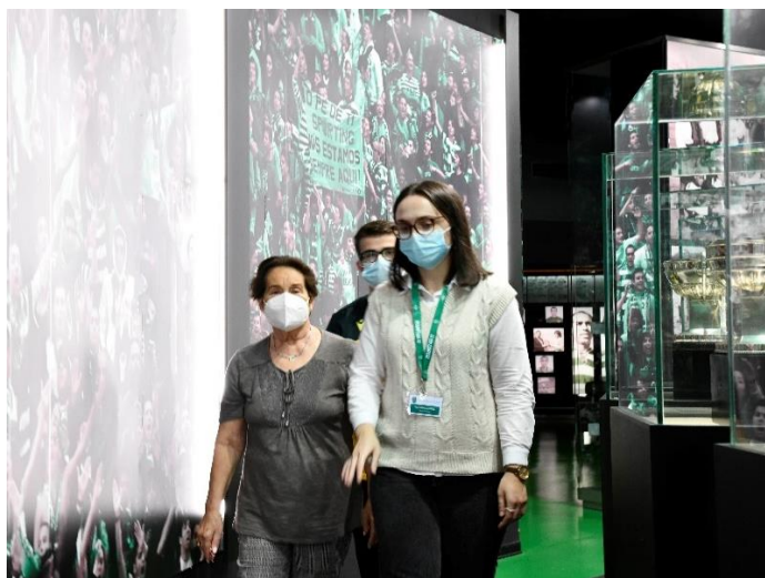
Figura 8 - Acompanhamento de uma visita ao Museu Sporting no final da entrevista

Todos os entrevistados eram acompanhados até ao momento das gravações por mim ou por outro técnico do Centro de Memórias. No final das mesmas, era possível fazer uma visita ao museu onde podiam partilhar as suas histórias e recordar momentos vivenciados no clube.