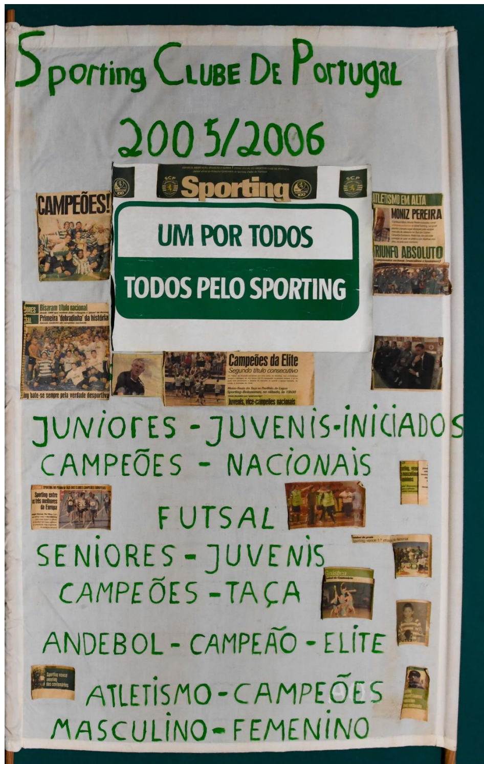
Anexo Figura 12 - Exemplo de Cartaz que foi inventariado após a entrevista