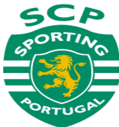
Figura 1 - Emblema Oficial do Sporting Clube de Portugal

Com o propósito de recordar o passado de gloria e nas proezas alcançadas, o lema do Clube é fundamentado na convicção de “Esforço, Dedicção, Devoção e Glória. Eis o Sporting”.