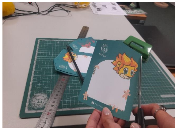
Figura 7 - Projeto de Natal

Para além disso cooperei em variadas tarefas como acompanhamento de visitas, pesquisas, apoio técnico e investigação para o trabalho académico.