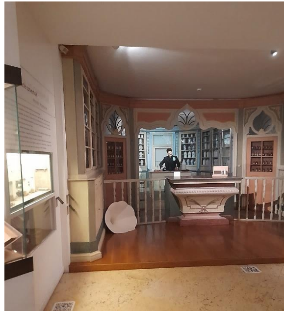
Figura 5 - Exposição Museu Da Farmácia

Um cuidado que têm é que estão atentos ao património que possa estar esquecido e que conseguem salvar para o preservar.