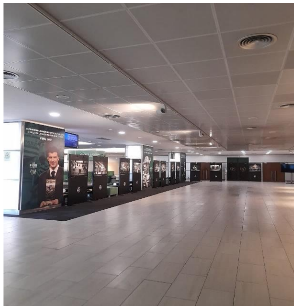
Figura 2 - Hall Vip, onde se inicia a visita ao Estádio José Alvalade

“A Rede Portuguesa de Museus é um sistema organizado de museus baseado na adesão voluntária, configurado de forma progressiva e que visa a descentralização, a mediação, a qualificação e a cooperação entre museus, de diversas tutelas e vocacionados para diferentes coleções.” (República Portuguesa) 20