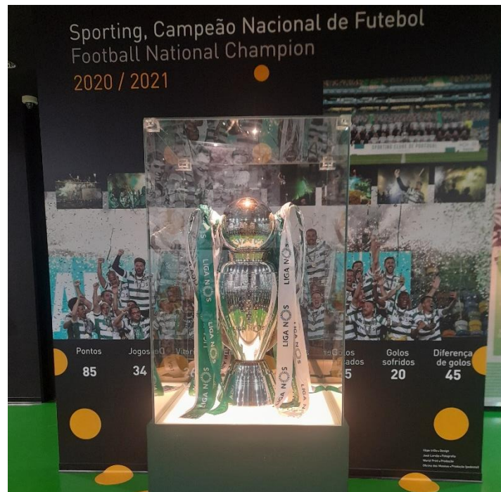
Figura 10 - Taça de Campeão Nacional 2020-2021 que pode ser vista no Museu Sporting