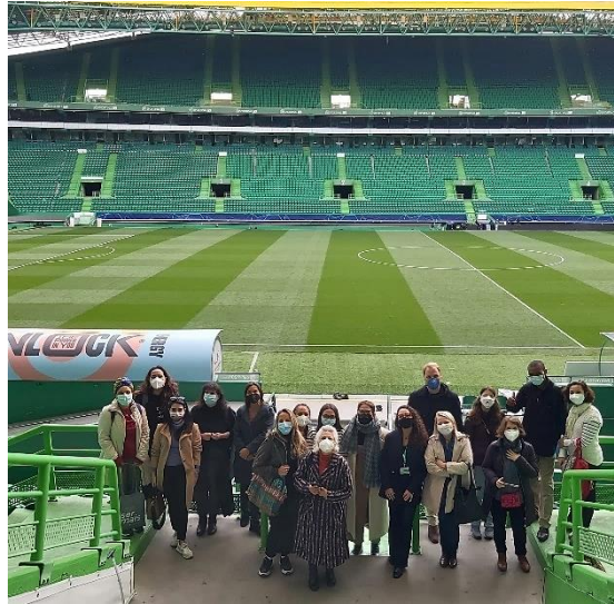
Figura 6 - Visita Técnica Turma Museologia ULHT

No decurso do estágio presenciei a entrega de diferentes taças, como o Campeonato do Mundo e Bicampeonato Europeu feminino e Taça de Portugal e Supertaça masculino de Goaball, ganhas durante a época de 2020-2021. Mas também o Campeonato Nacional, Liga Europa 2020-2021 e Taça Continental pela equipa de Hóquei em Patins 2021-2022. As cerimónias têm a presença dos atletas e equipas técnicas, e do Presidente do Conselho Diretivo, neste caso Frederico Varandas, que apoiam e felicitam os atletas pelas conquistas.