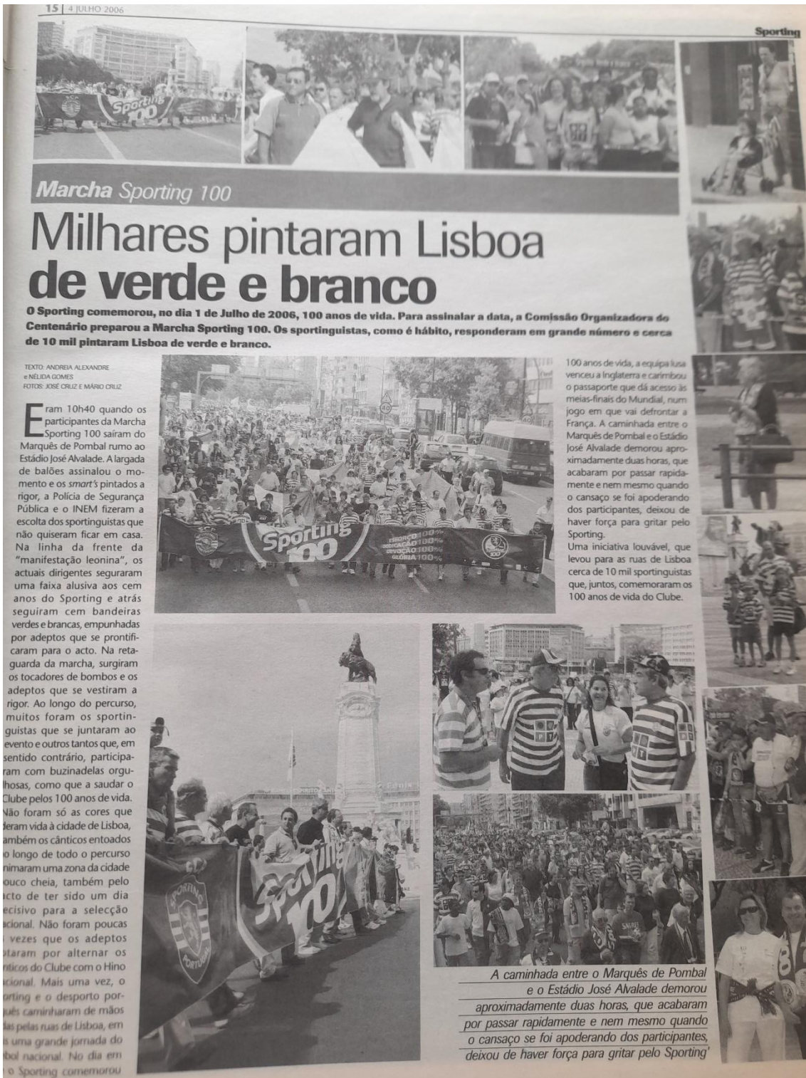
Anexo Figura 11 - Exemplo de um Jornal Sporting pesquisado nos arquivos do museu