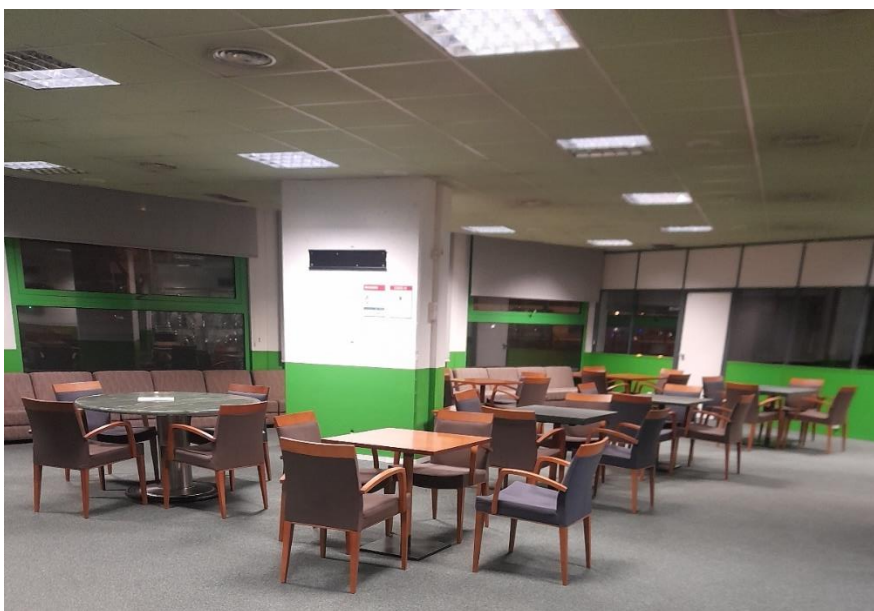
Figura 9 - Sala anexa ao Museu Sporting, onde se realizaram as entrevistas

Ocasionalmente, surgiam pessoas no museu para conversar ou visitar, e os mesmos tinham memórias que eram identificadas como importantes para o Centro de Memórias e para o projeto. Assim sendo, eram convidados a partilhar os seus momentos de uma maneira espontânea.