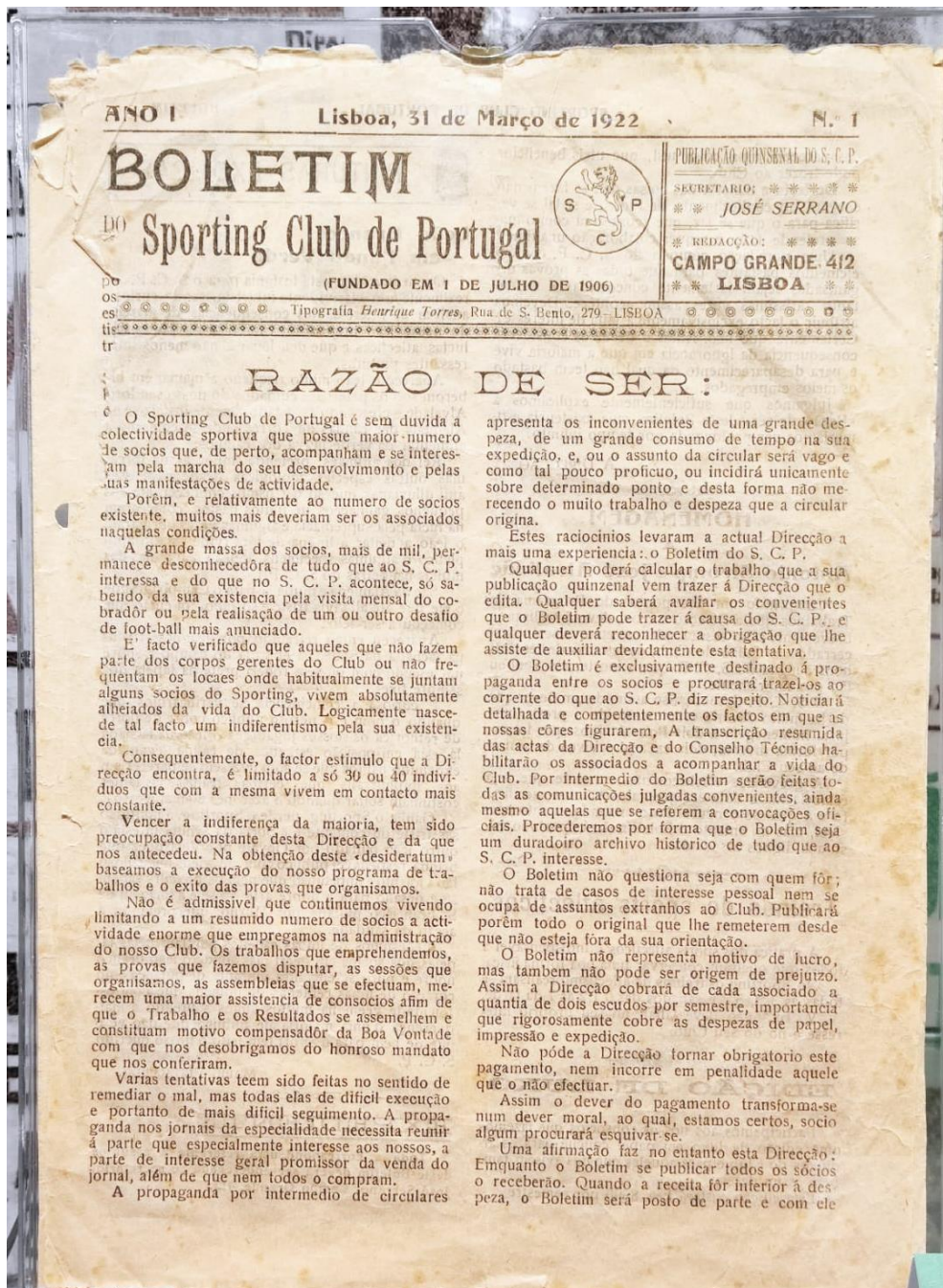
Anexo Figura 13 - 1º Boletim informativo do Sporting C.P