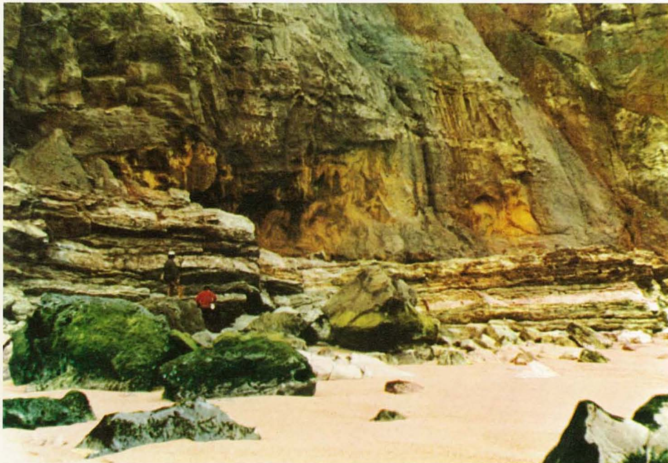
Fig. 1 — Aspecto da arriba no local de colheita. No primeiro plano os calcários do Cenomaniano médio (?). Sobre estes a formação em cuja base foi detectada a copiapite (manchas amareladas).