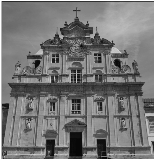
Fig. 2: Fachada da igreja das Onze Mil Virgens, do antigo colégio do Santíssimo Nome de Jesus, Coimbra, c. 1640.

Relativamente à igreja conhecida como sendo “dos Paulistas”, cuja fundação data de 1554 e cuja sagração remete para 1680, a realização da sua fachada não deverá andar distante desta última data 21 .