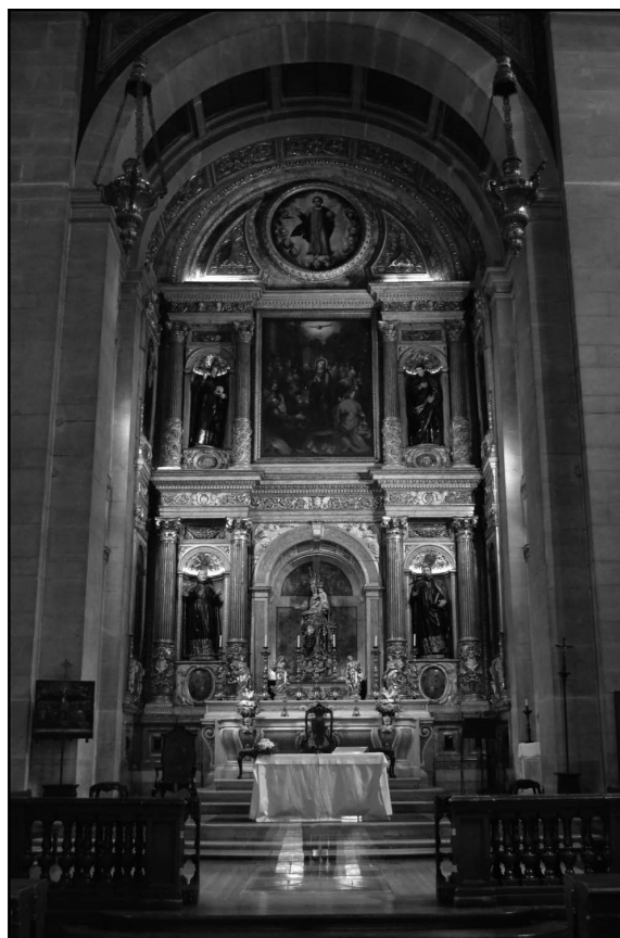
Fig. 3: Retábulo da capela-mor da igreja de São Roque, Lisboa, c. de 1628-1630.

Exemplares igualmente significativos para a compreensão destas estruturas são aqueles retabulares concebidos em materiais idênticos da igreja de São João Baptista de Abrantes, hoje com adições de talha barroca e pintura, e com datação imprecisa (Fig. 4). Complementarmente, se observarmos algumas soluções não retabulares, mas aplicadas em panejamentos murários de interiores sacros, como ocorreu com as dos alçados da capela-mor da igreja de Nossa Senhora da Luz de Lisboa, de c. 1575-1596, onde se preencheram os panos entre pilastras estriadas com as esculturas dos 12 Apóstolos e dos 4 Evangelistas e a Virgem, constatamos que algumas das estruturas de fachadas elencadas mimetizaram estes esquemas geométricos