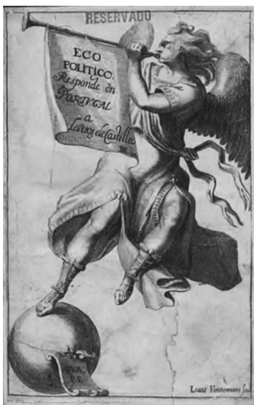
Figura 2 – Gravura que ilustra o livro de Francisco Manuel de Melo, Ecco Polytico. Responde en Portugal a la voz de Castilla y satisface a un papel anonymo, ofrecido al Rey Don Felipe el Quarto. Sobre los intereces de la Corona Lusitana, y del Oceanico, Indico, Brasilico, Ethyopico, Arabico, Persico, y Africano Imperio (Lisboa, Paulo Craesbeeck, 1645).

Algum tempo depois surgiu a obra Philippica Portugueza, contra la invectiva castellana (Lisboa, A. Alvarez, 1645), de frei Francisco de Santo Agostinho de Macedo, também ela uma resposta de carácter doutrinal ao conselheiro castelhano. Refira-se que esta obra contou com uma versão latina, publicada em França: Propugnaculum lusitano-gallicum contra calumnias hispano-belgicas (Paris, 1647). Meses mais tarde, ainda em 1645, o famoso polígrafo Francisco Manuel de Melo também se envolveu na controvérsia, respondendo ao anónimo conselheiro através de um tratado que ostentava o seguinte título: Ecco Polytico. Responde en Portugal a la voz de Castilla y satisface a un papel anonymo, ofrecido al Rey Don Felipe el Quarto. Sobre los intereces de la Corona Lusitana, y del Oceanico, Indico, Brasilico, Ethyopico, Arabico, Persico, y Africano Imperio... Publicado no final de 1645