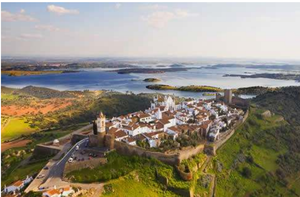
Figura 1 – Monsaraz e o lago de Alqueva