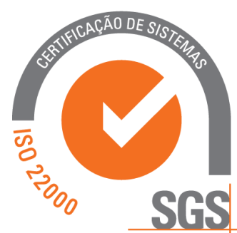
Figura 2.1 – Norma ISO 22000

A Norma ISO 22000 estabelece os requisitos necessários para a implementação de sistemas de segurança que possam ser aplicados em qualquer organização da cadeia alimentar, e engloba os requisitos de sistema de gestão, o programa de pré-requisitos e os requisitos relacionados com a implementação de sistemas de HACCP ( Hazard Analysis and Critical Control Points ). Ser um sistema de gestão integrável com outros referenciais e visar a harmonização de requisitos de segurança alimentar internacionalmente, são algumas das vantagens desta norma (Queiroz, 2006; Queiroz, 2008).