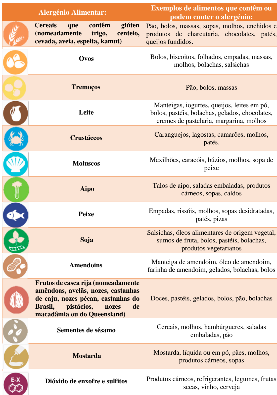
Tabela 2.3 - Os 14 alergênicos alimentares e exemplos de alimentos que contêm ou podem conter esses alergênicos