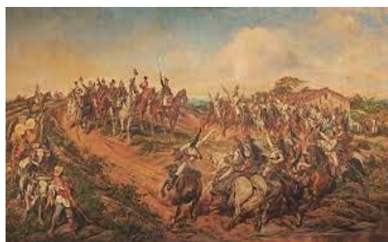
Figura 2 - Independência ou Morte, Pedro Américo, 1888