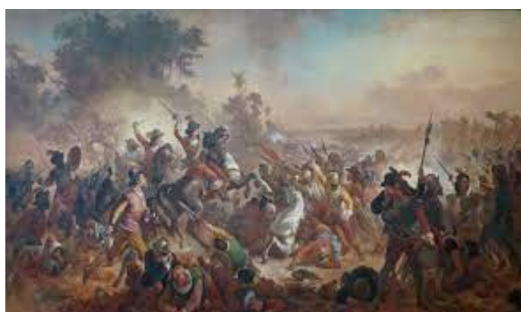
Figura 1 - Batalha de Guararapes, Victor Meirelles, 1879

Em 19 de Abril de 1994, então com a patente de 1º Tenente, participei da 1ª formatura oficialmente instaurada em comemoração ao “Dia do Exército Brasileiro”. O saguão do Quartel General do Comando Militar do Sudeste, onde se deu o evento, é ornado em suas paredes laterais com a reprodução de duas das telas do século XIX, ambas das mais expressivas da história militar e da própria identidade brasileira: de um lado, a Batalha dos Guararapes, de Victor Meirelles; do outro, Independência ou morte, de Pedro Américo.