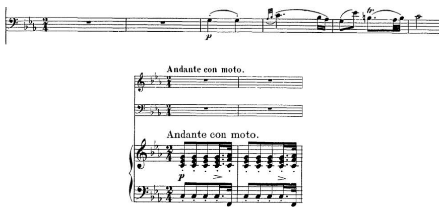
Ex. 1: Segundo andamento do Trio op. 100 de Schubert - primeira frase do violoncelo e motivo de acompanhamento (c. 1-6)

acompanhamento (ver Exemplo 1). Esta melodia é caracteristicamente romântica pela intensidade transmitida por todos os contrastes já referidos e defronta-se com a atuação que constrói as personagens: uma atuação fria e crua, desprovida de expressão emocional.