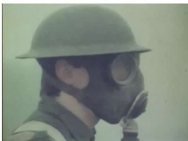
Fig. 2: Primeiro plano do filme Os dois soldados

Ramuz com a Grande Guerra leva a uma primeira determinação do espaço-tempo em que se passará a narrativa que, no entanto, se vai tornando cada vez mais difusa. Logo à partida, temos a narrativa da obra músico-teatral que, apesar de ter sido composta e escrita no contexto da Primeira Guerra, se refere a um conto popular russo, na versão recolhida por Afanas'yev, em nada relacionado temporal ou espacialmente com esse contexto. Esta narrativa faz do excerto musical mais uma alusão ao folclore, pilar narrativo das três “curtas encantadas”, do que à Primeira Guerra Mundial. Além disso, temos um outro elemento musical, quando o soldado curado da cegueira frequenta uma típica festa do norte de Portugal, em parte, determinada espacialmente pelos gigantones, os cabeçudos e os músicos Zés Pereiras acompanhados pela gaita de foles, instrumento típico dessa região 11 . Ainda há a referência a um rei que, em conjunto com a localização do evento, nos transporta para conflitos ibéricos de outros tempos 12 , também em nada relacionados com a Primeira Guerra.