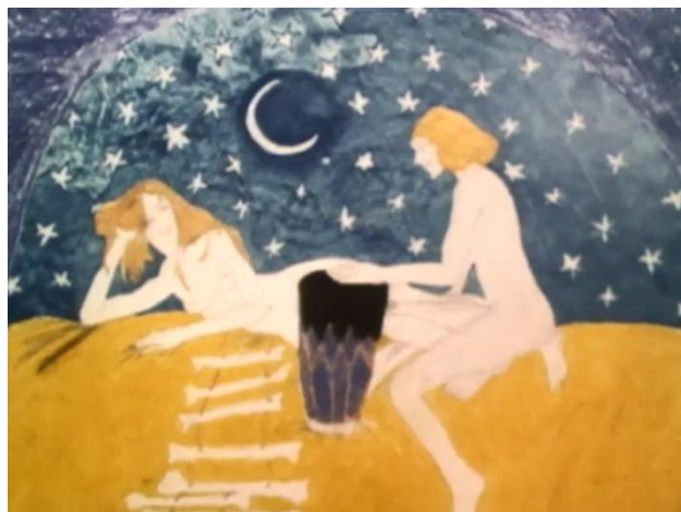
Fig. 5: Última ilustração de O amor das três romãs

Em contrapartida, o filme desmascara a artificialidade do cinema através de um paradigma de representação que mostra a obra em construção. Nesse sentido, a alusão ao disfarce e ao fingimento extravasa para a estrutura da curta-metragem, baseada na exposição dos dispositivos de representação cinematográfica. Isto é, a ação em cenários pintados é intercalada com a pintura dos ditos cenários, com a leitura do conto num livro e com os desenhos que parecem ilustrar a história. Este dispositivo em construção retira o espectador do espaço de ação para o colocar no local de rodagem, despertando estranheza espacial e temporal a partir da interação inusitada de diferentes componentes fílmicos. Desta forma, estabelece-se uma relação entre a estrutura e a narrativa, que resulta num modelo de representação fílmico experimental.