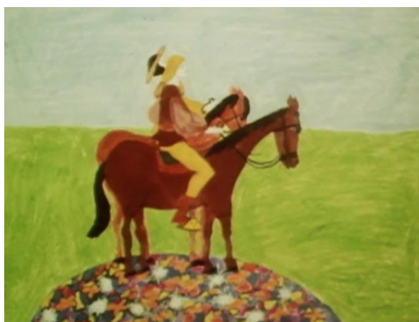
Fig. 4: Príncipe e Papa-folhas montados num cavalo

Aos 2 min 15 s, ouvimos um excerto da obra Uma brincadeira musical (K. 522) de Mozart (1787) sobre o plano estático de uma pintura que retrata o príncipe e o papa-folhas a cavalo num campo verde e florido (ver Figura 4). Ao longo do filme, voltamos a ouvir este divertimento para duas trompas e quarteto de cordas outras seis vezes. Embora os excertos sejam relativos a diferentes partes e andamentos da obra, ouvimo-los sempre em simultâneo ao plano visual de pinturas que retratam certos aspetos da narrativa. Tais momentos, constituem-se como pequenos interlúdios músico-visuais, com alusões diretas a elementos diegéticos do conto – são, assim, ilustrações desta história, em forma de pintura infantil, enfatizando os elementos ficcionais da narrativa e afastando-se taxativamente do sistema realista muitas vezes adotado pelo cinema. Com estas cenas, desmascara-se o sistema narrativo e alude-se à versão escrita dos contos infantis, normalmente recheada de ilustrações que moldam a nossa imaginação do espaço-tempo.