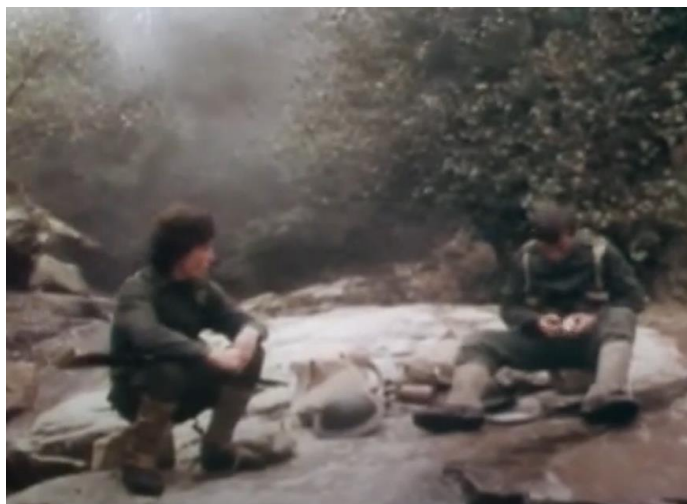
Fig. 3: Soldados comem perto de um riacho

A Marche triomphale du diable corresponde à última parte da obra de Ramuz e Stravinsky. Assim, a primeira e última cenas da obra músico-teatral correspondem à primeira e última cenas do filme de Monteiro (lembramos que a Marche du soldat se ouve três vezes na peça, uma delas, na primeira cena). A marcha do final da peça representa um triunfo do diabo sobre o soldado que, mesmo depois de se casar com a princesa, não consegue deixar de ambicionar o que não pode alcançar. No filme, não há referência a este triunfo do mal sobre o bem. No entanto, a música pode representar essa visão pouco otimista sobre os valores morais da sociedade. No mais, e talvez mais relevante neste caso, temos, novamente, uma marcha pouco usual, não condizente com a grandeza bélica normalmente associada ao retrato cinematográfico do poder militar.