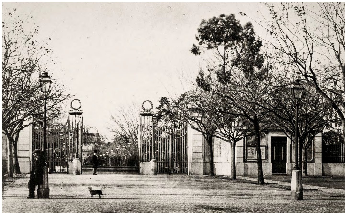
1. Entrada sul do Passeio Público (c. 1838).

Distingue-se na paisagem processos abruptos inerentes a crises e conflitos armados e ainda outros continuados de construção, conservação, envelhecimento, abandono e demolição justificados por alterações políticas, sociais, culturais e económicas graduais. Estes processos antrópicos revelam-se bem mais cáusticos quando acentuados por caprichos de decisores ou opções precipitadas, infundadas ou ignorando relatórios técnicos nos quais se alerta para agentes, dinâmicas, vulnerabilidades, riscos e até sinergias dificilmente controláveis. Alterações drásticas em contextos urbanos, que se refletem sobre obras mais frágeis como parques e jardins públicos, podem resultar de pressões, oportunidades de retorno