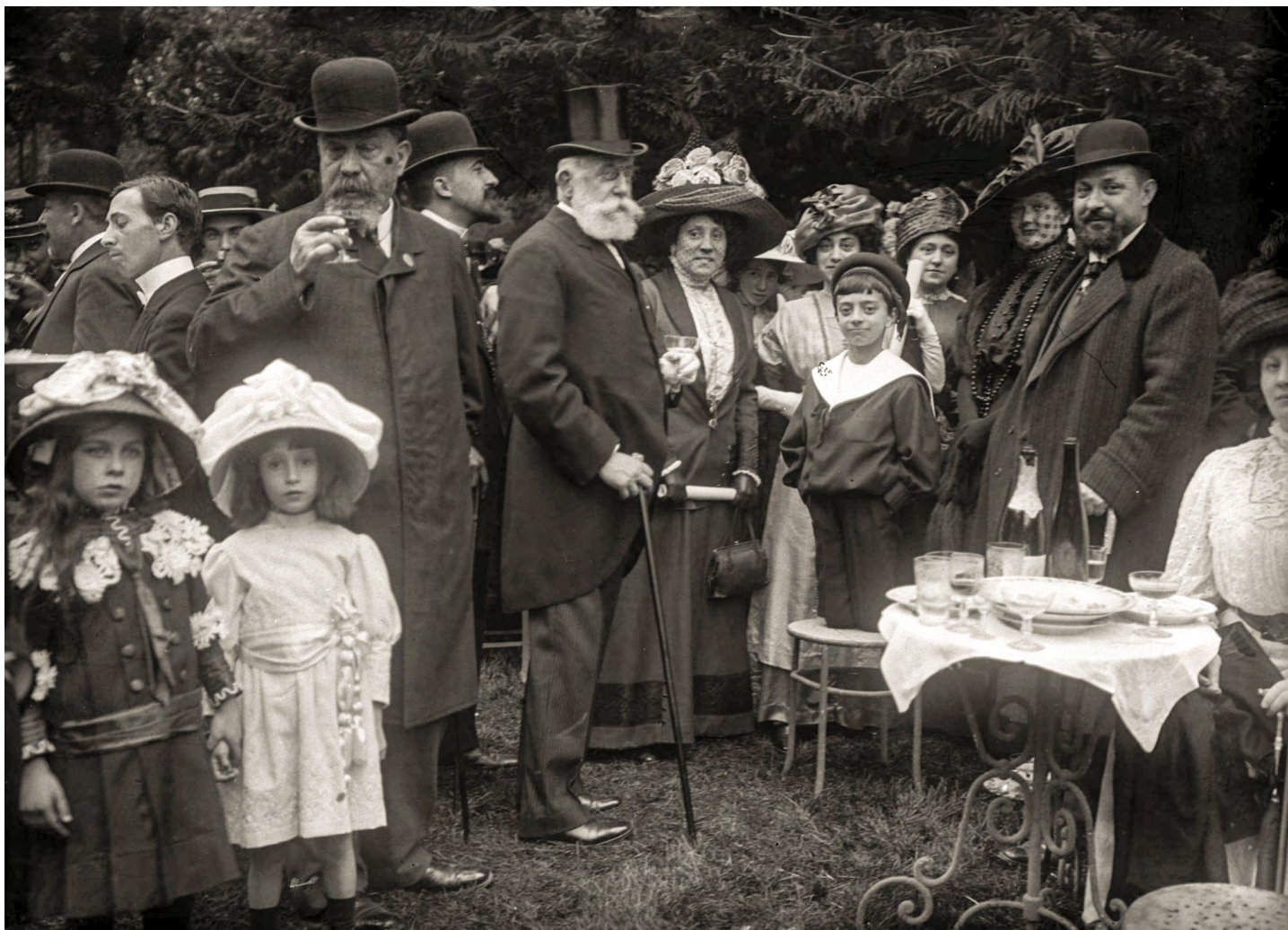
7. Garden party no jardim da Estrela. Joshua Benoliel, 1911. Arquivo Municipal de Lisboa.

Samora Correia e Santo Estêvão; pelos anos 30 foi palco do rapto do pequeno António Francisco pela Velha dos Gatos, sendo então considerado lugar pouco seguro; vários registos confirmam os danos da passagem do ciclone em 1941 e a sequente recuperação de Ernest François Pissard (1850-1934). Com o decorrer dos anos, o jardim sofre algumas alterações e beneficiações, e por pouco não é destruído com a intenção de prolongar a Av. Álvares Cabral e dividir este espaço. Após grande contestação, esta ideia acabou por não ser executada. Pelo envelhecimento e contaminação biológica