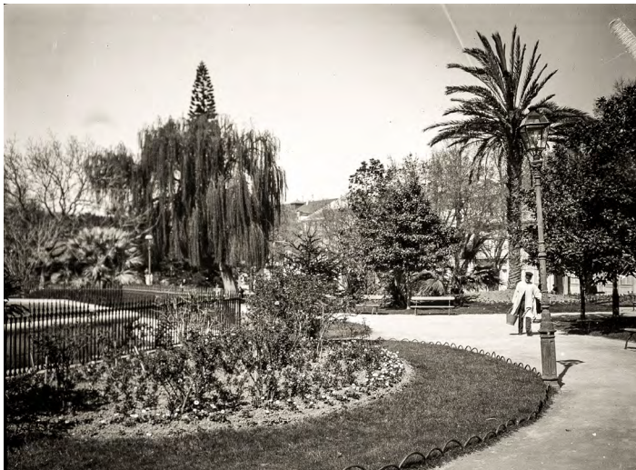
12. Jardim do Príncipe Real. Joshua Benoliel, 1911. Arquivo Municipal de Lisboa.