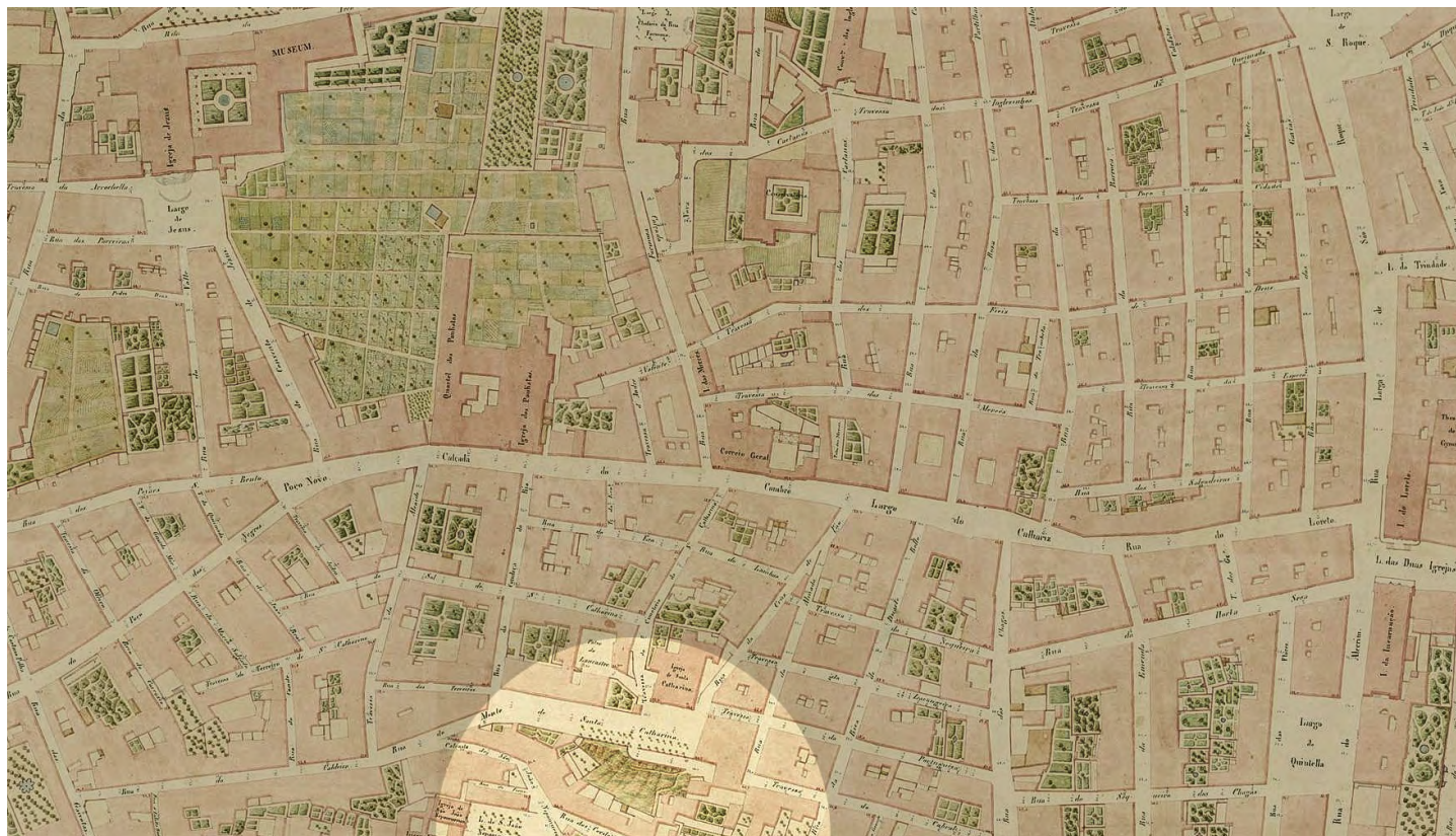
15. Miradouro de Sta. Catarina. Atlas da carta topográfica de Lisboa. Filipe Folque, 1857-09. folha nº 42. Arquivo Municipal de Lisboa.

O projeto executado substitui a calçada de vidro por lajes de lioz e os canteiros orgânicos e característicos de um jardim romântico por um talude relvado rematado por bancos formados por blocos paralelepípedicos também de lioz. As guardas foram também alteradas, permanecendo apenas o “Adamastor” como único elemento do jardim na sua versão de 1927. Esta solução veio a revelar-se vulnerável pela fragilidade dos componentes pétreos, facilmente esquináveis e mancháveis, pela dificuldade da sua limpeza e manutenção,