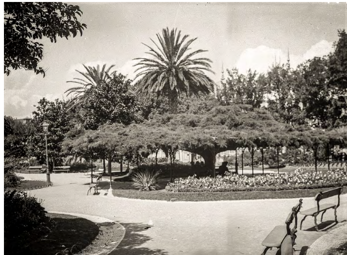
13. Jardim do Príncipe Real. Joshua Benoliel, 1911. Arquivo Municipal de Lisboa.