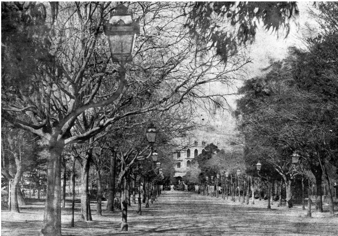
5. Alameda central pouco antes da demolição. José Artur Bárcia, c. 1883. Arquivo Municipal de Lisboa.

Contrastando com as linhas formais e rígidas do Passeio Público, o jardim da Estrela é inaugurado em 1852, como um jardim que reflete a vivência de Lisboa à data, com um carácter romântico bem marcado. Concebido por dois mestres jardineiros, João Francisco e Jean-Baptiste Désiré Bonnard (1797-1861) e por Pierre Joseph Pézerat (1801-1872) que projeta um pavilhão para o jardim, toma o nome do bairro em que se insere. É um jardim moderno, um jardim definido então como “à inglesa” com os seus lagos e canteiros de forma quase