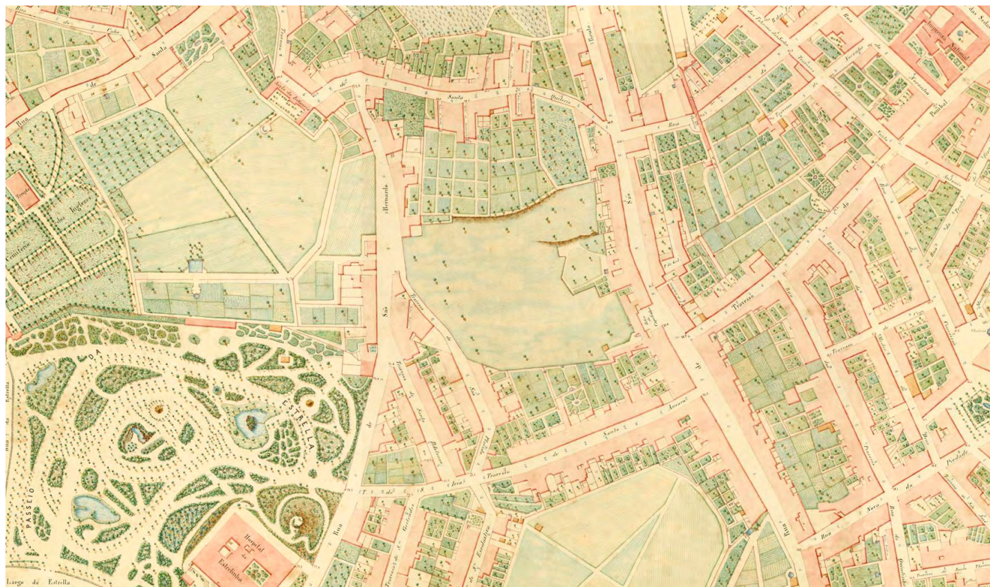
6. Jardim Guerra Junqueiro. Atlas da carta topográfica de Lisboa. Filipe Folque, 1857-09. folha nº 34.

Vieram para este jardim, numa primeira fase, algumas peças de estatuária do Passeio Público que contribuíam também para esse espírito quase bucólico. Mais tarde, após a implantação da República, várias outras estátuas são colocadas no jardim e marcam definitivamente o seu carácter, sendo “O cavador”, de Costa Motta (tio), uma das mais conhecidas. Segue-se, em 1932, o antigo coreto da Avenida da Liberdade. Acompanhando a nova forma de utilização destes espaços e refletindo o que se desejava na Lisboa de então, este jardim passa a ser um dos locais preferenciais para a realização de feiras, exposições e quermesses. É palco da propaganda do Estado Novo através de inaugurações de equipamentos