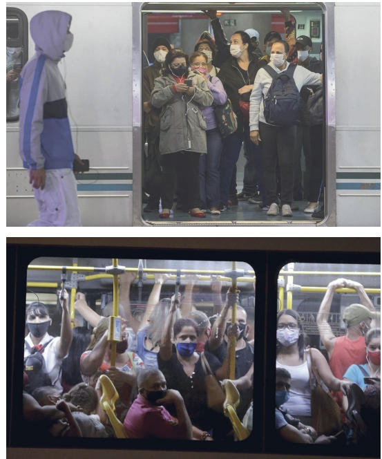
Figura 2 ▶ Transporte público lotado durante a pandemia da covid-19. À esquerda, metrô em São Paulo, à direita, ônibus no Rio de Janeiro.