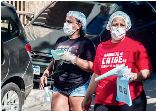
Figura 4 ▸ Mobilizações sociais de conscientização e distribuição de alimentos no Complexo do Alemão, realizadas pelo Gabinete do Alemão (iniciativa da sociedade civil).