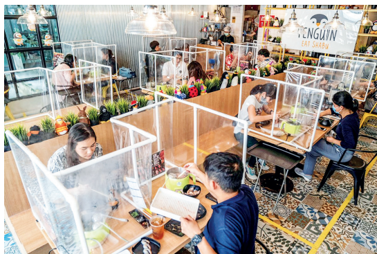
Figura 3 ▸ Alternativas “criativas” para o público continuar frequentando parques e restaurantes mesmo diante da necessidade de distanciamento social.

Segundo Rolnik e Wisnik (2020), nos locais onde o Estado exclui as populações socialmente periféricas, surgem movimentos de resistência de corpos em vulnerabilidade social e sanitária. No Brasil, lugar em que o Estado se faz duplamente ausente – não só no negacionismo, como na estigmatização dos corpos socialmente periféricos –, observamos redes comunitárias, criadas a partir de movimentos de autogestão, que fornecem alimentos, produtos de higiene pessoal, assistência à saúde e – principalmente – informação sobre a pandemia e meios de prevenir o contágio.