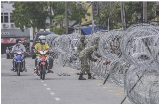
Figura 1 ▶ Isolamento de Selayang Baru, área próxima a Kuala Lumpur (Malásia), onde foram confirmados casos de covid-19. A partilha de suprimentos entre pessoas não isoladas e isoladas pelas cercas de arame farpado deve receber autorização das forças policiais, preocupadas com o "controle da disseminação do vírus".