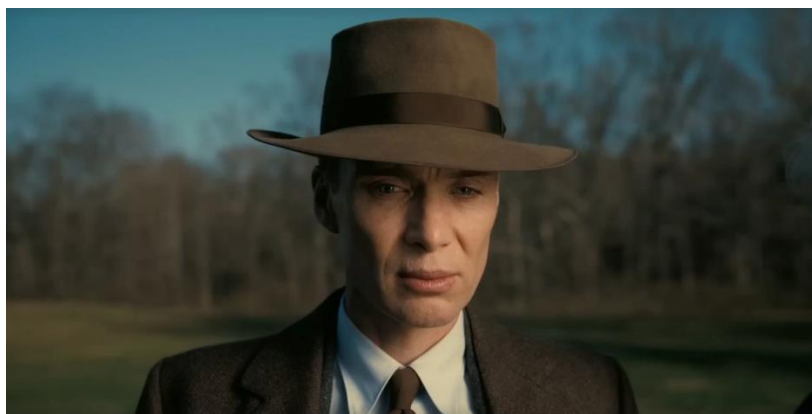
Figura 10- J. Robert Oppenheimer, interpretado por Cillian Murphy