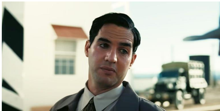
Figura 18- Edward Teller, interpretado por Benny Safdie