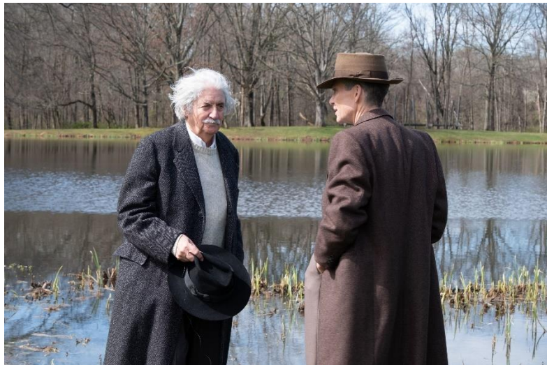
Figura 24- Albert Einstein, interpretado por Tom Conti, com Oppenheimer