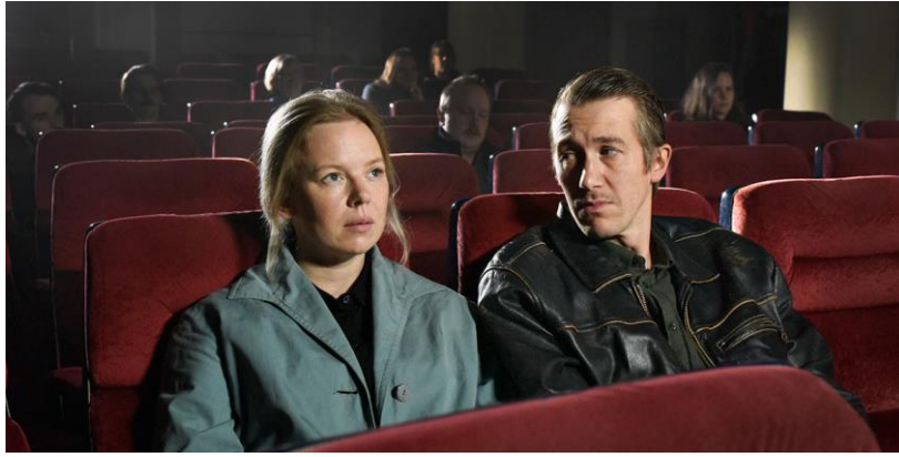
Figura 31- As personagens no cinema