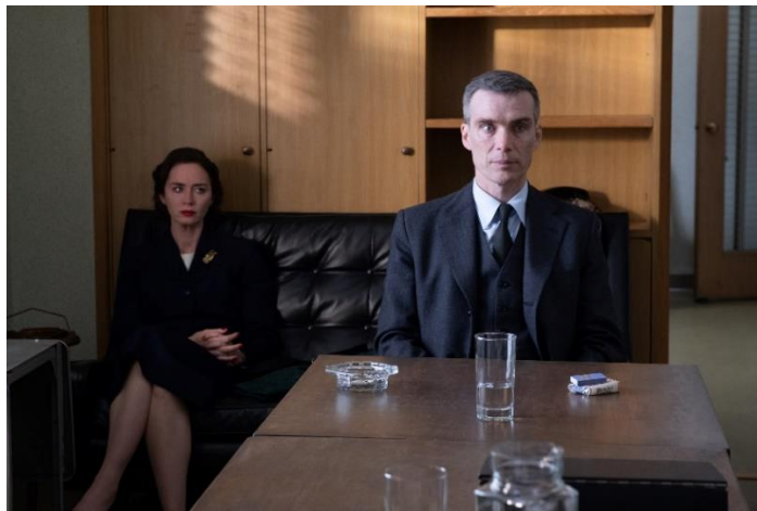
Figura 21- Kitty e Robert Oppenheimer nas sessões de interrogatório