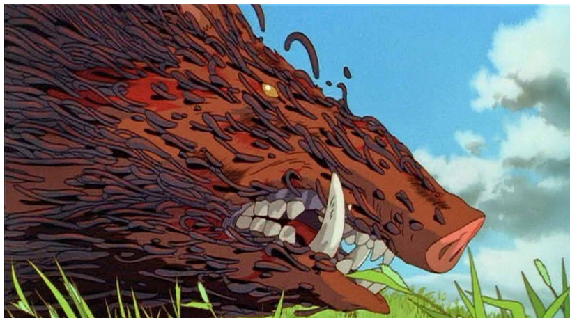
Figura 2- Deus em forma de javali que amaldiçoou Ashitaka