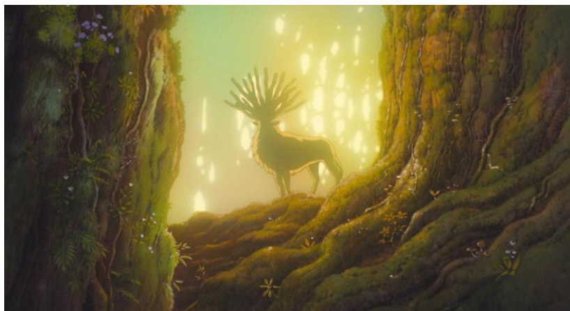
Figura 3- Shishigami