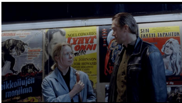
Figura 30- As personagens à porta do cinema