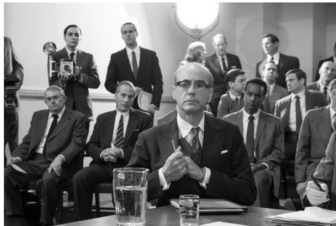
Figura 22- Lewis Strauss na audiência do Senado