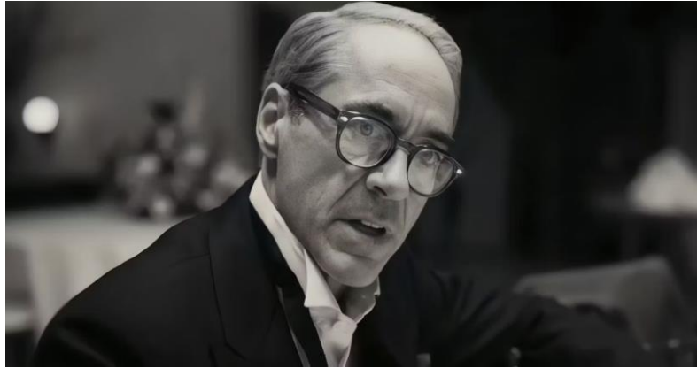
Figura 12- Lewis Strauss, interpretado por Robert Downey Jr.