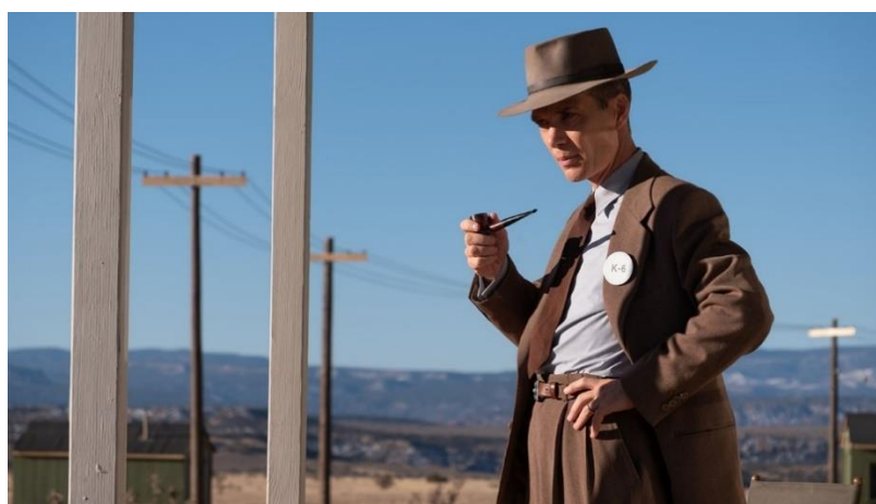
Figura 11- J. Robert Oppenheimer, interpretado por Cillian Murphy