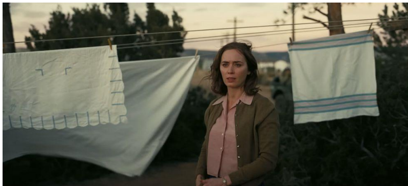
Figura 14- Kitty Oppenheimer, interpretada por Emily Blunt