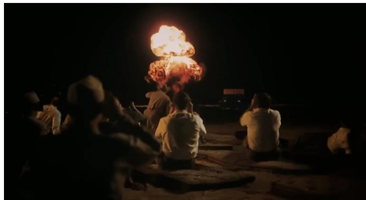
Figura 19- Explosão da bomba no teste Trinity