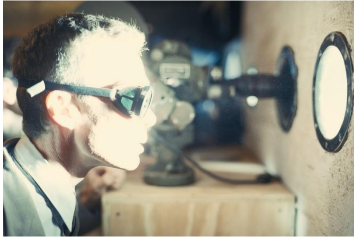
Figura 20- Oppenheimer a observar a explosão da bomba, no teste Trinity