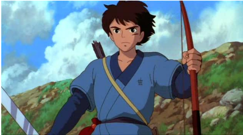
Figura 1 – Ashitaka