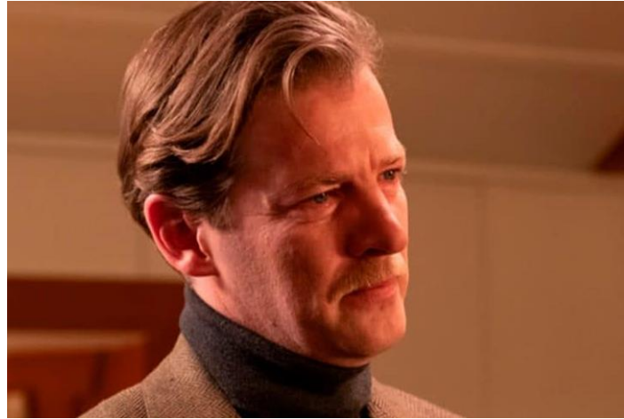
Figura 16- Chevallier, interpretado por Jefferson Hall