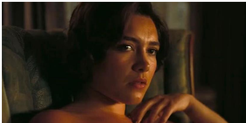
Figura 15- Jean Tatlock, interpretada por Florence Pugh