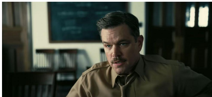
Figura 17- Leslie Groves, interpretado por Matt Damon