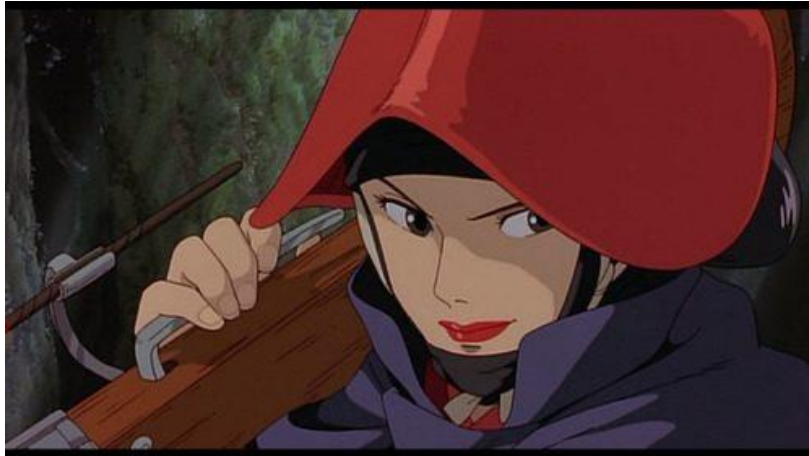
Figura 4- Lady Eboshi