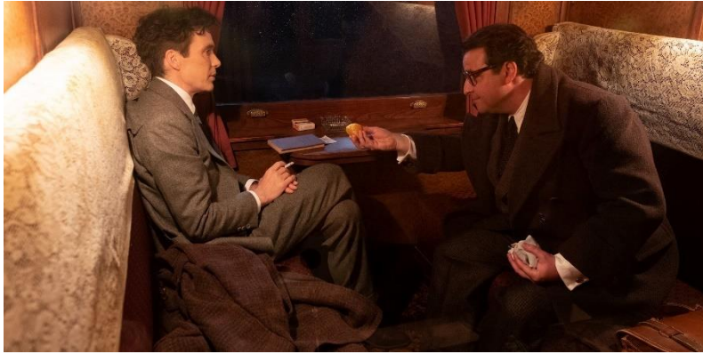
Figura 23- Isidor Rabi, interpretado por David Krumholtz, com Oppenheimer