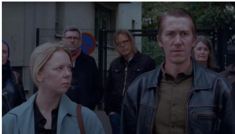
Figura 29- Quando o bar em que Ansa trabalha encerra, as personagens encontram-se por coincidência