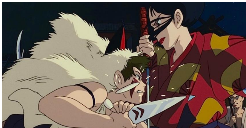
Figura 8- San tenta matar Lady Eboshi