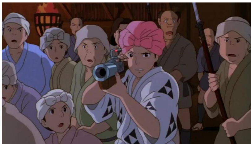
Figura 5- Alguns dos residentes da Cidade do Ferro