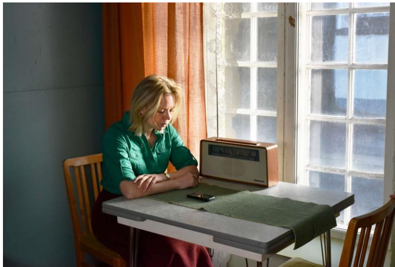
Figura 32- Ansa com o rádio ao lado