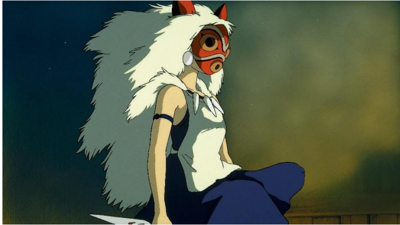
Figura 7- San (Princesa Mononoke)