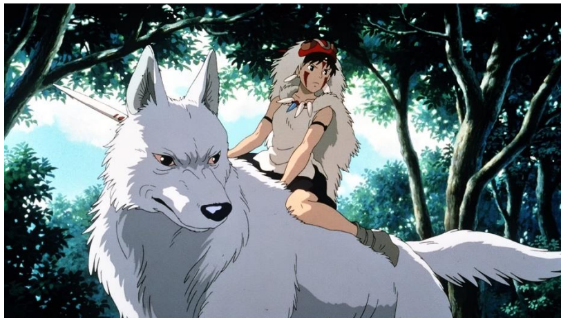
Figura 6- San (Princesa Mononoke) e Moro