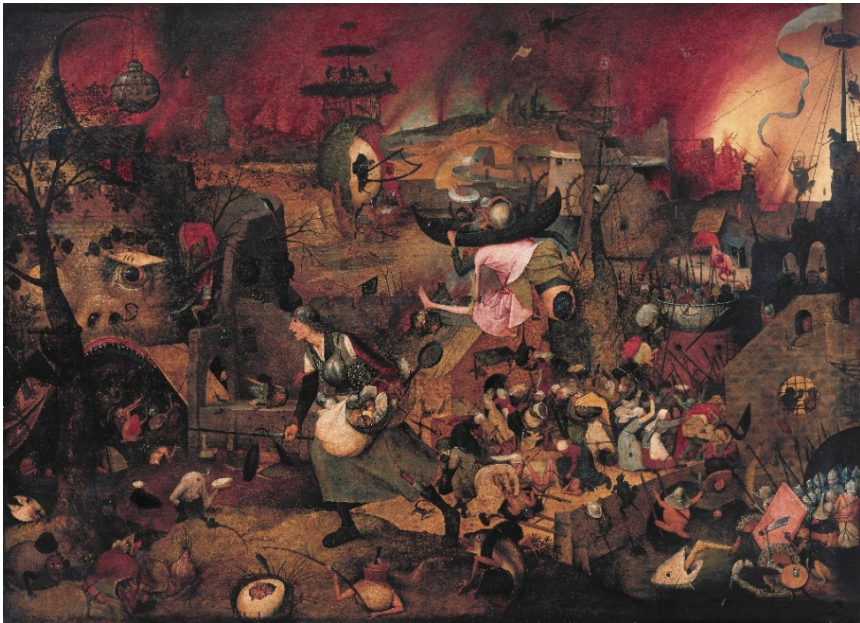
Figura 3 - Dulle Griet (1563), de Pieter Brueghel, o Velho - Museu Mayer van den Bergh, Antuérpia.

221-222 e 2009: 30-34). Frei Abel não tem onde se refugiar, sendo aquele o compartimento mais sagrado do mosteiro... E, no entanto, é como se a noção de tempo-espaço que conglomerava a existência espiritual do frade se distorcesse, perturbando a noção de espacialidade, no que à vida pós-morte concerne. A imagética que desponta a seus olhos provoca no monge uma estranheza que o integra num não-espaço – ou num espaço não recognoscível no seu imaginário religioso, de alguma forma racionalizado na sua estrutura mental – o que é equacionado pelo leitor como um drama interior vivenciado por frei Abel, que não tem para onde se evadir. Ressalve-se, contudo, e na senda do que preconiza Linda Hutcheon (HUTCHEON 1981: 147), que o conceito paródia se assume como “une forme littéraire sophistiquée” e não integra, obrigatoriamente, um sema de comicidade, podendo assumir uma índole reverencial. Os dicionários etimológicos fazem remontar o vocábulo paródia ao substantivo grego παρωδία ; quanto ao prefixo παρά , que surge na base da sua formação, pode traduzir-se por “ao lado de” (BAILLY 1989: 1456), evidenciando, assim, o ethos respeitoso nele contido.