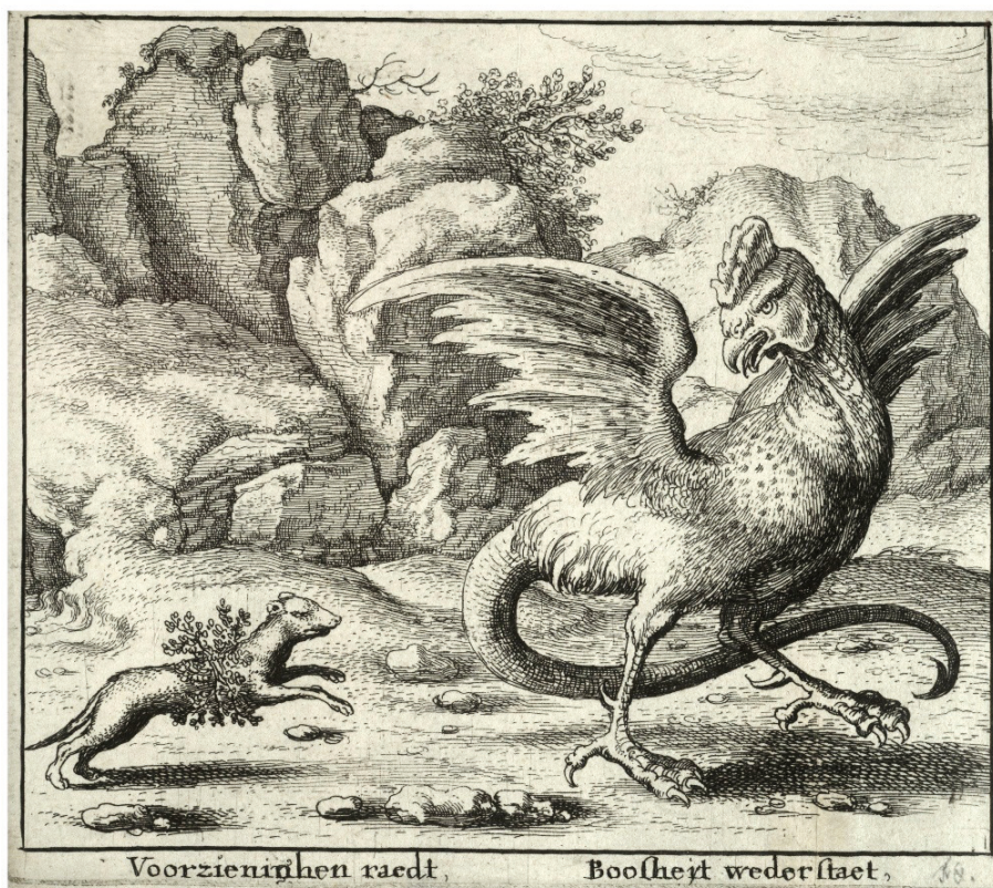
Figura 2- O basilisco e a doninha. Gravura de Wenceslaus Hollar, séc. XVII.

O significado alegórico do basilisco ancora na exegese bíblica, surgindo sete vezes referenciado na Vulgata, sempre integrado num contexto apocalíptico e pecaminoso, personificando a injustiça, a mentira, a inveja e a luxúria, ou o próprio Anticristo, de que somente a proteção angelical pode resguardar (CHEVALIER & GHEERBRANT s/d: 116).