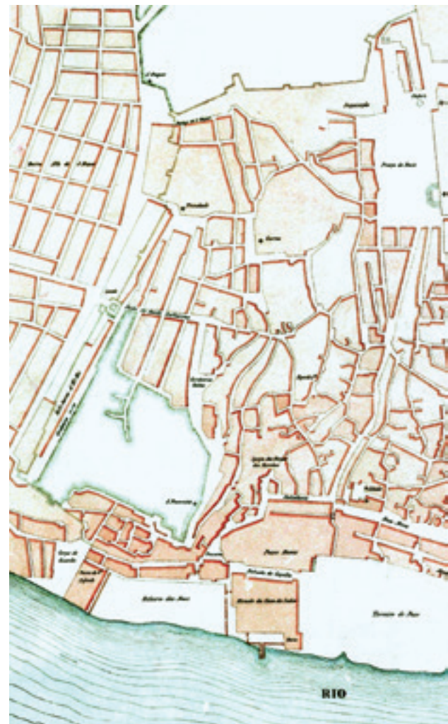
Fig. 4 – Pormenor de planta anónima de Lisboa a ocidente da muralha fernandina que deverá datar de cerca de 1590 (em cima à esquerda).

O dado mais importante a destacar na apreciação da gravura de Lisboa aqui equacionada é o de que ela não mostra a cidade como era em 1598, como por vezes é referido, mas sim em data anterior. Com efeito a análise das figurações de monumentos que aí se encontram e das respectivas legendas apontam para a hipótese de estarmos perante um trabalho realizado por volta de 1566 ou 1567, na medida em que nele não há qualquer construção feita depois de 1566. Com efeito será desta última data a edificação da igreja de São Paulo representada nesta planta e que cronologicamente se afigura ser o último edifício então construído que aí foi incluído 3 . É ainda de ponderar que esta igreja não tem junto a si o número 108 da legenda que a referencia. São também de considerar na atribuição da cronologia