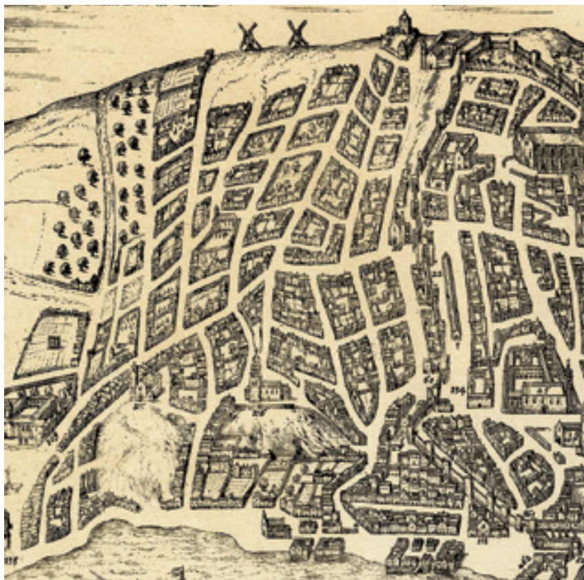
Fig. 3 – Pormenor da parte ocidental da planta de Lisboa publicada em Urbium praecipiarum mundi theatrum quintum , 1598 de acordo com um desenho cujo original poderá datar de cerca de 1567.

A planta de Lisboa divulgada a partir de 1598 constitui a mais completa fonte iconográfica de entre as que mostram a cidade quinhentista, pois permite visualizar