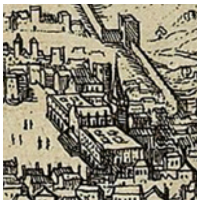
Fig. 7 – Pormenor de gravura publicada em Urbium praecipuarum mundi theatrum quintum , volume 5, 1598, de acordo com uma planta de cerca de 1567 (à direita)