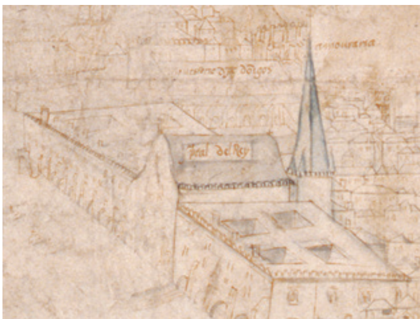
Fig. 8 – Pormenor de uma vista de Lisboa na Biblioteca Universitária de Leiden, cerca de 1550-1570?