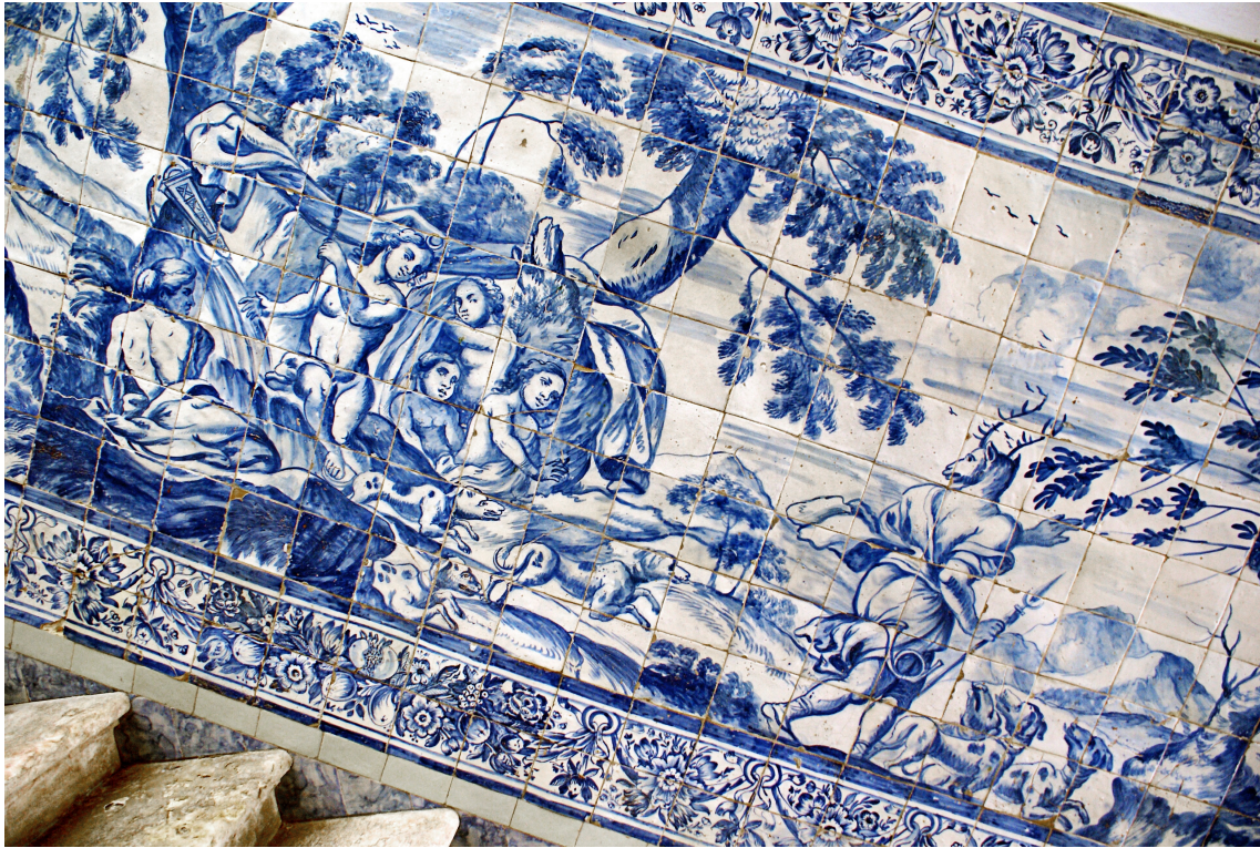
Figura 5 Gabriel del Barco (atrib.) Diana e Actéon , Palácio dos Duques de Lafões, painel de azulejos da primeira metade do século XVIII