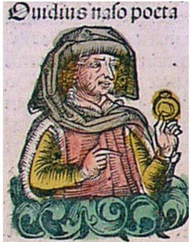
Figura 1 Desconhecido. Publius Ovidius Naso , iluminura, Crónica de Nuremberga, 1493 [2]

Os primeiros anos da sua produção foram dedicados à elegia amorosa, em voga na época. Por volta dos 45 anos, no auge da sua reputação como poeta elegíaco, Ovídio deixou a poesia erótica para se dedicar a dois projectos importantes: os Fastos (calendário poético do ano romano, em que cada livro corresponde a um mês) e as Metamorfoses . No ano 8 d.C Ovídio foi condenado por Augusto ao exílio, sob a acusação de maiestas (atentado contra a pessoa, política ou autoridade do imperador). Desterrado numa pequena cidade da actual Roménia, que nada tinha a ver com a sofisticação de Roma, o poeta classificou a um amigo o seu exílio, justamente de metamorfose . Neste período escreveu os cinco livros de Tristia e as Epístolas do Ponto . Ovídio nunca mais regressaria a Roma, falecendo no ano 17 d.C. (Alberto 2007, 11-14).