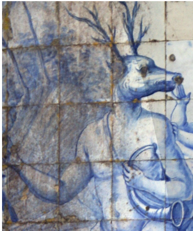
Figura 8a Trompa de caça (pormenor)