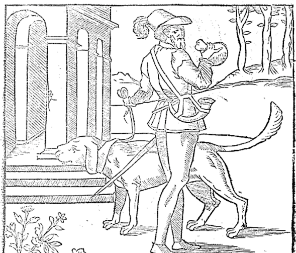
Figura 5 Du Foiulloux. La Venerie , 1561 [18]

Actéon, dado este ser caçador. O modelo de trompa representado é antigo, muito difundido em gravuras europeias do século XVI. Encontramos o mesmo modelo no tratado de caça, La Venerie de Jacques Du Fouilloux (1561). Duas conclusões podem ser tiradas não sendo estas, necessariamente, contraditórias: a) o uso prático, em Portugal, de modelos de trompa antigos no contexto da caça; b) o uso de fontes-modelos iconográficos para cópia - de séculos