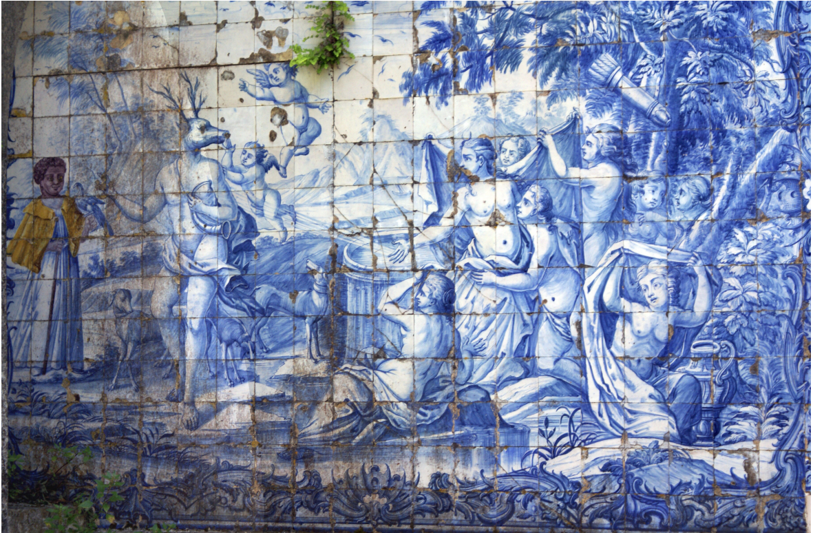
Figura 8 Desconhecido. Diana e Actéon , Palácio do Correio-Mor, Loures, painel de azulejos da primeira metade do século XVIII