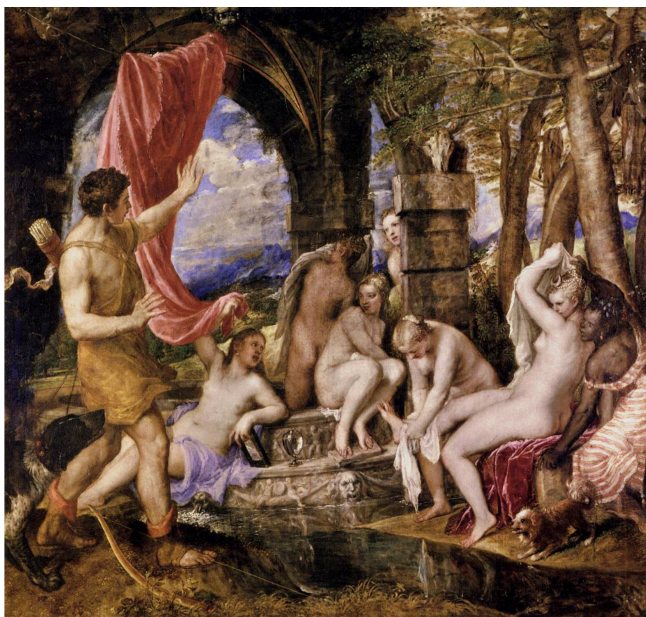
Figura 2 Ticiano. Diana e Atteone óleo sobre tela, National Gallery of Scotland, Edimburgo, Escócia, 1556-1559 [16]