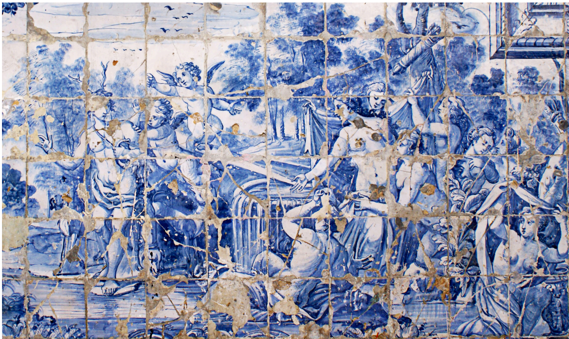
Figura 7 – Desconhecido. Diana e Actéon , Largo das Alcaçarias, Lisboa, painel de azulejos da primeira metade do século XVIII (fot. Luzia Aurora Rocha)

Bastante importância é atribuída ao banho de Diana, numa total harmonização entre a utilidade prática (e pública) do local e a representação iconográfica decorativa [22]. A deusa é surpreendida por Actéon e os seus cães enquanto se banhava nua. As ninfas tentam cobri-la, apressadamente, mas Diana, furiosa e num total gesto de vingança, salpica-o com água, momento este que marca o terrível desfecho da história, a morte do jovem caçador pelos seus cães, que não mais o reconhecem após a sua metamorfose em cervo. O pintor de azulejos acrescentou ainda dois putti , que tentam desviar Actéon do seu terrível destino, mas o inevitável já aconteceu. É, deste modo, vã a tentativa de o afastar, pois os chifres nascem já na sua cabeça, perante o espanto dos seus cães. A presença dos putti parece indicar uma motivação diferente: o Amor. Há aqui um elemento iconográfico de muito interesse: a representação de Actéon ainda com rosto humano. Há, assim, um rosto por detrás de uma morte. O ênfase trágico é maior, o impacto, no observador, também. Relativamente ao modelo de trompa de caça, verifica-se um retrocesso ao nível organológico: em pleno século XVIII, representa-se a trompa de caça de forma muito semelhante à do painel do