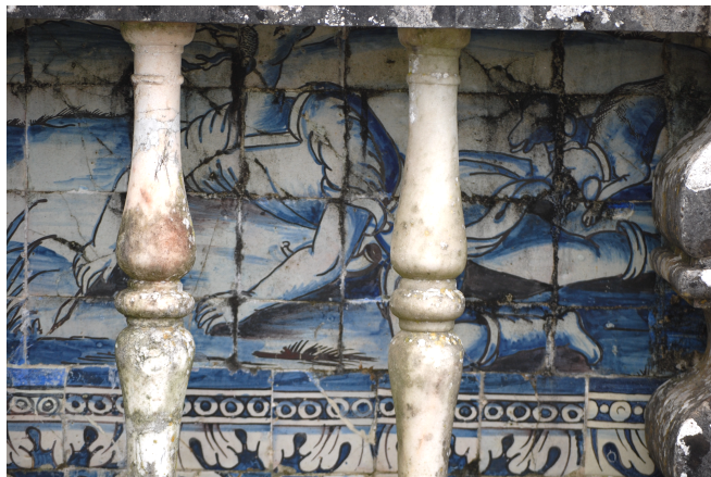
Figura 3 Desconhecido. Actéon devorado pelos seus cães , Palácio Fronteira, Lisboa, finais do século XVII